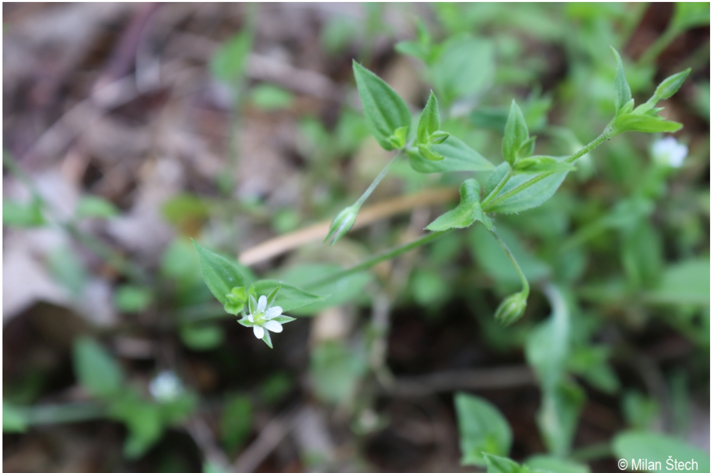
Moehringia trinervia – Milan Štech – Olšina, Suchý vrch.