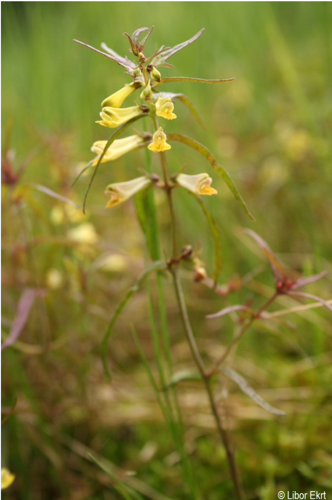
Melampyrum pratense – Libor Ekrt – Kepelské Zhůří.