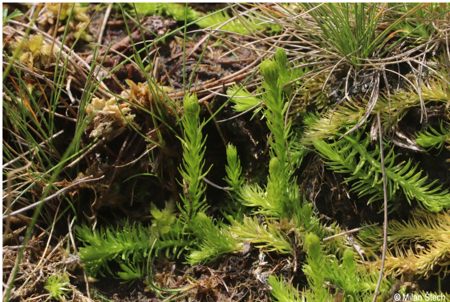
Lycopodiella inundata – Milan Štech – Kleiner Schwarzbach.