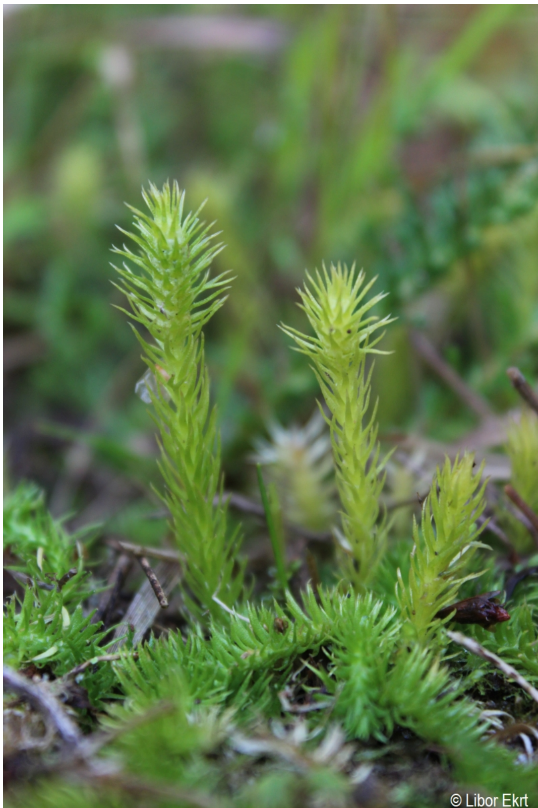
Lycopodiella inundata – Libor Ekrť – Klášterec.