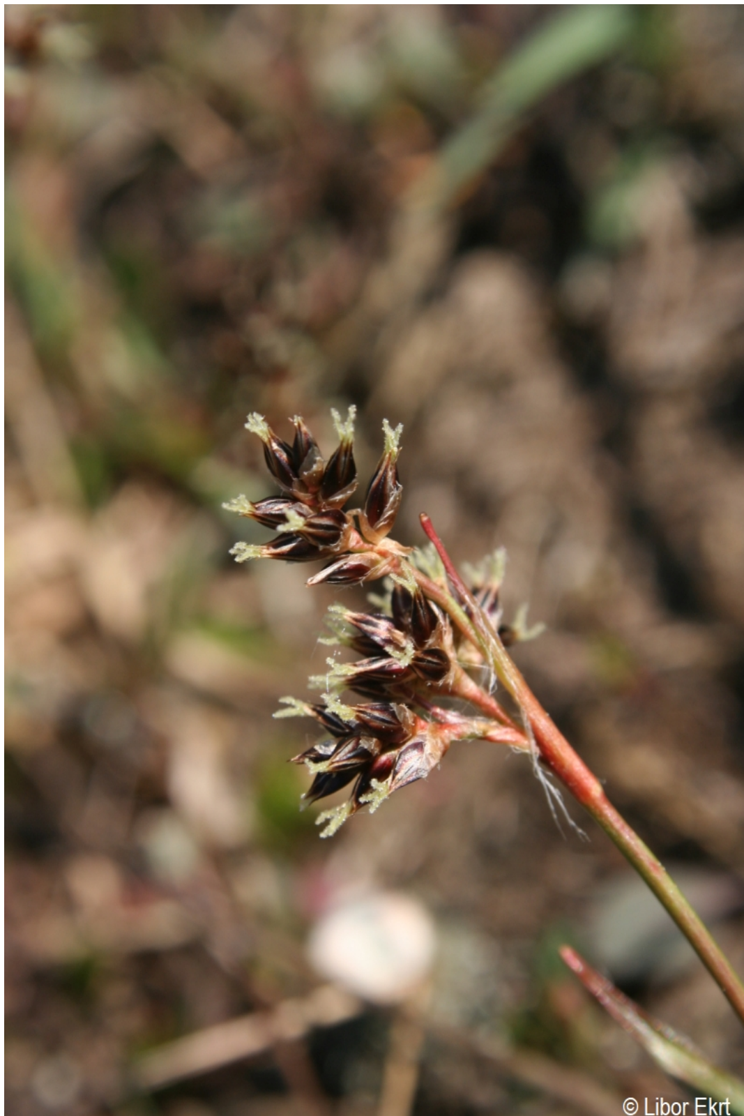
Luzula multiflora – Libor Ekrť – České Žleby.