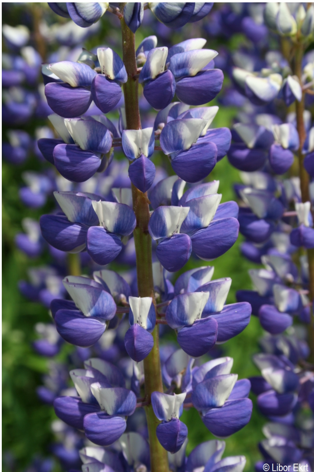
Lupinus polyphyllus – Libor Ekrť – Soumarský Most.