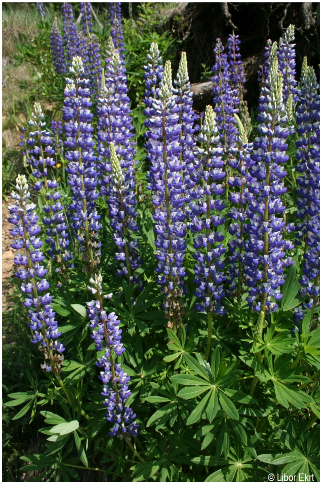
Lupinus polyphyllus – Libor Ekrť – Soumarský Most.