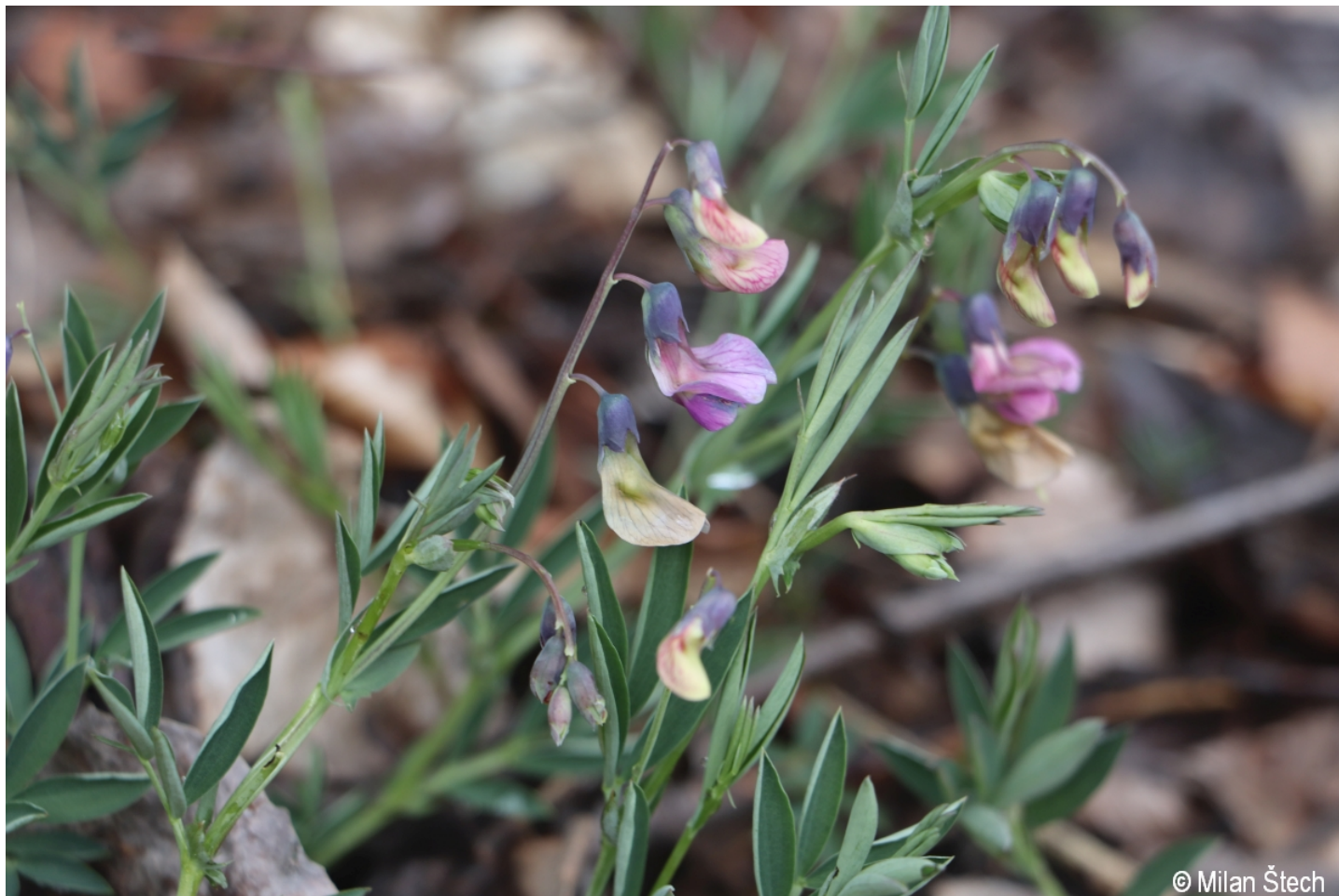
Lathyrus linifolius – Milan Štech – Hojsova Stráž.