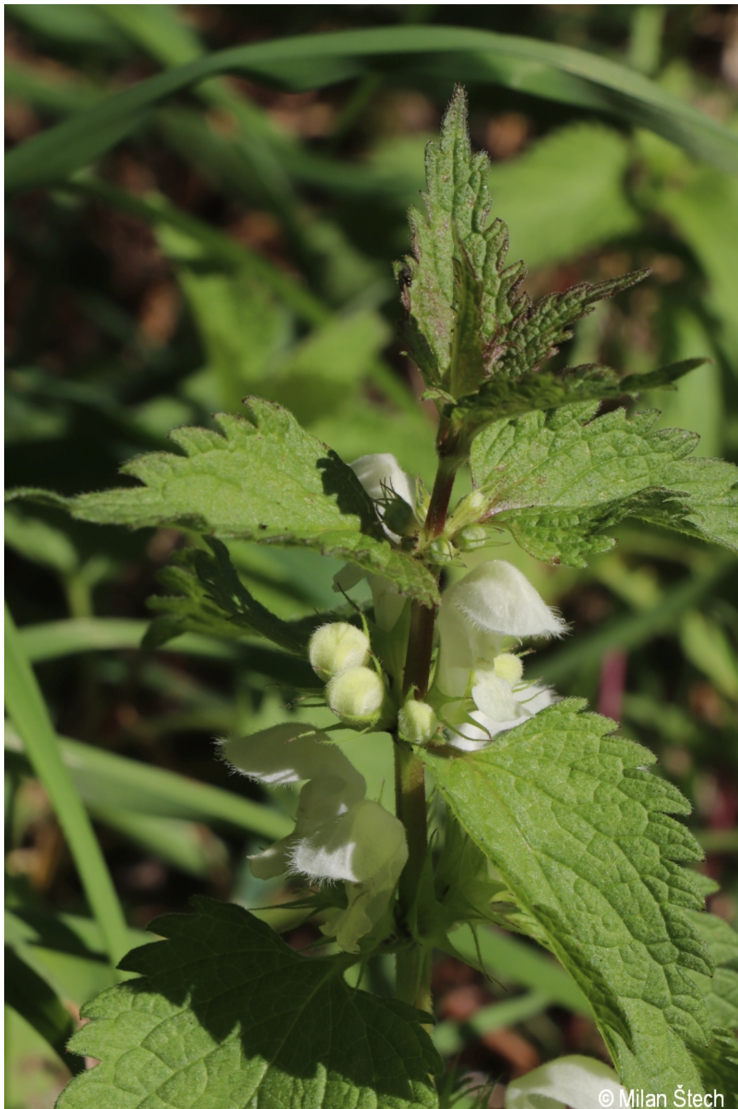
Lamium album – Milan Štech – Dračí skály.