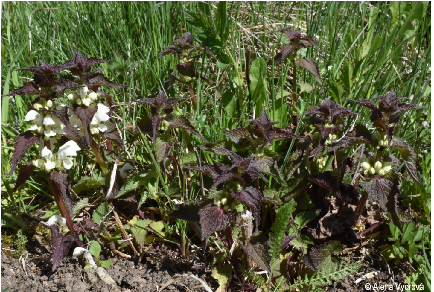
Lamium album – Alena Vydrová – Zbytiny - nádraží.