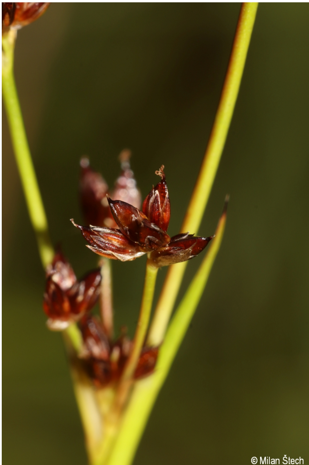
Juncus articulatus – Milan Štech – Strážný.