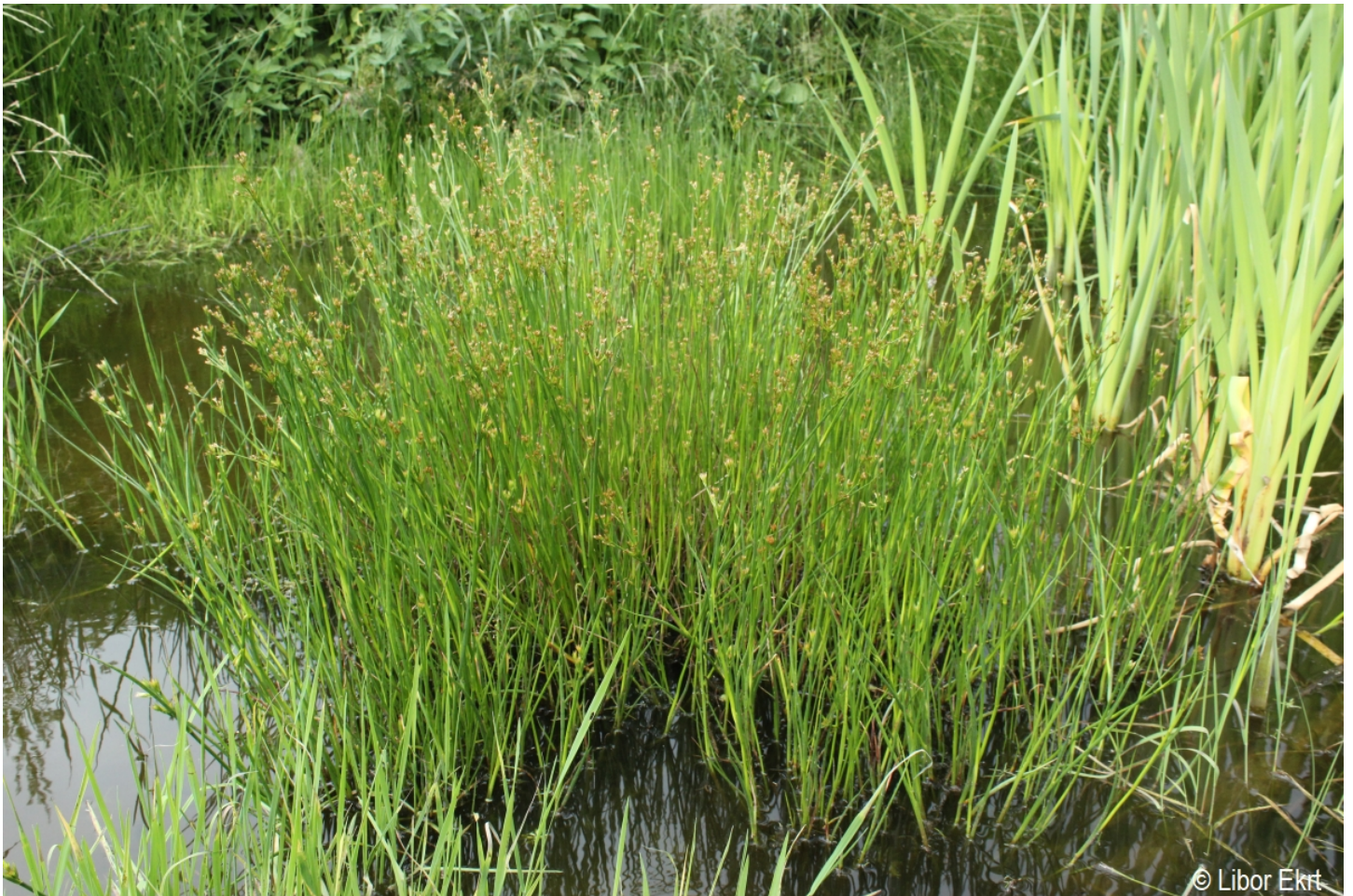
Juncus articulatus – Libor Ekrť – Černá v Pošumaví.