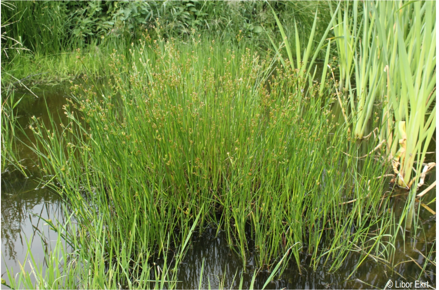
Juncus articulatus – Libor Ekrť – Černá v Pošumaví.