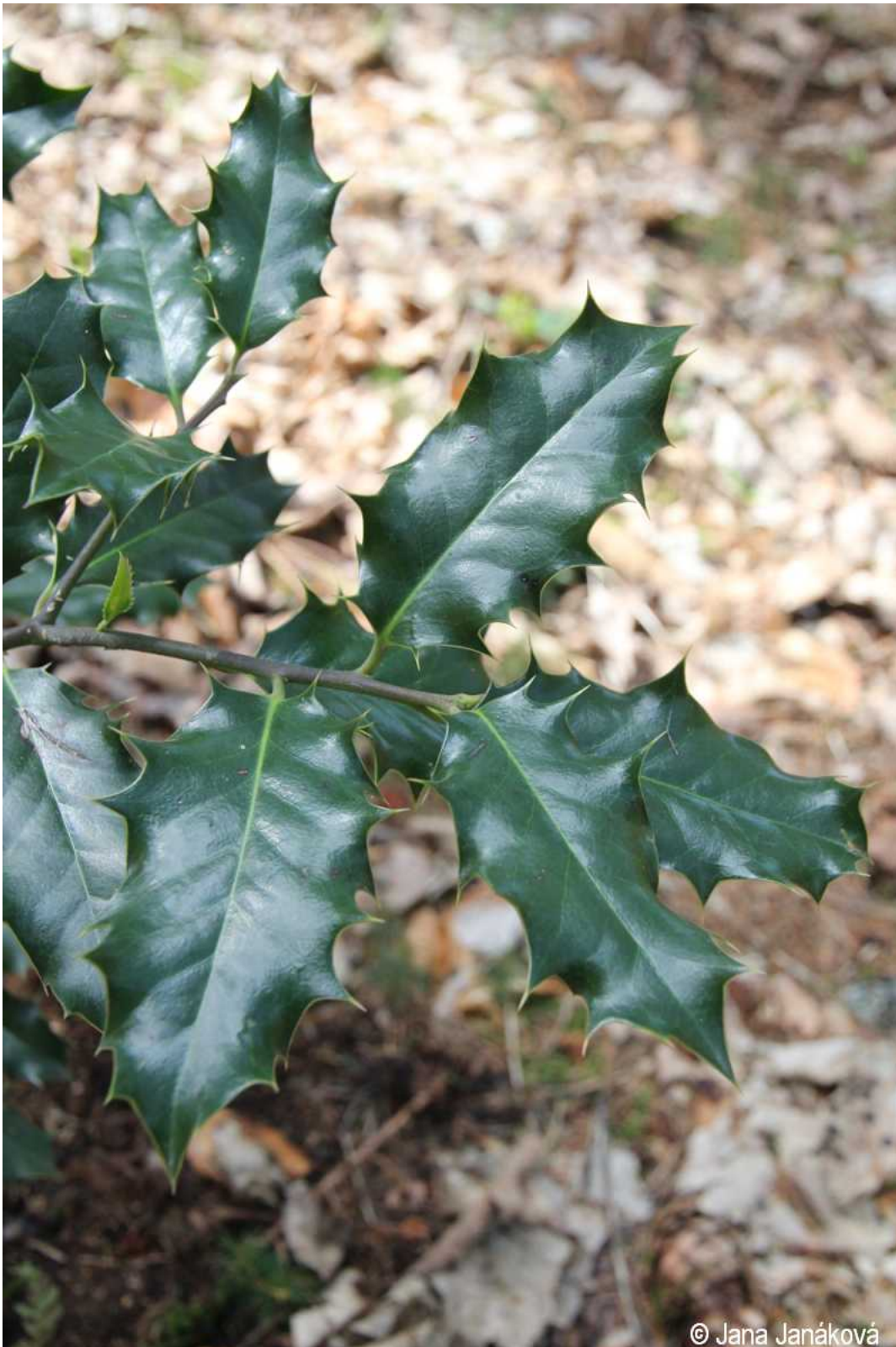
Ilex aquifolium – Jana Janáková – Uhlířský vrch.