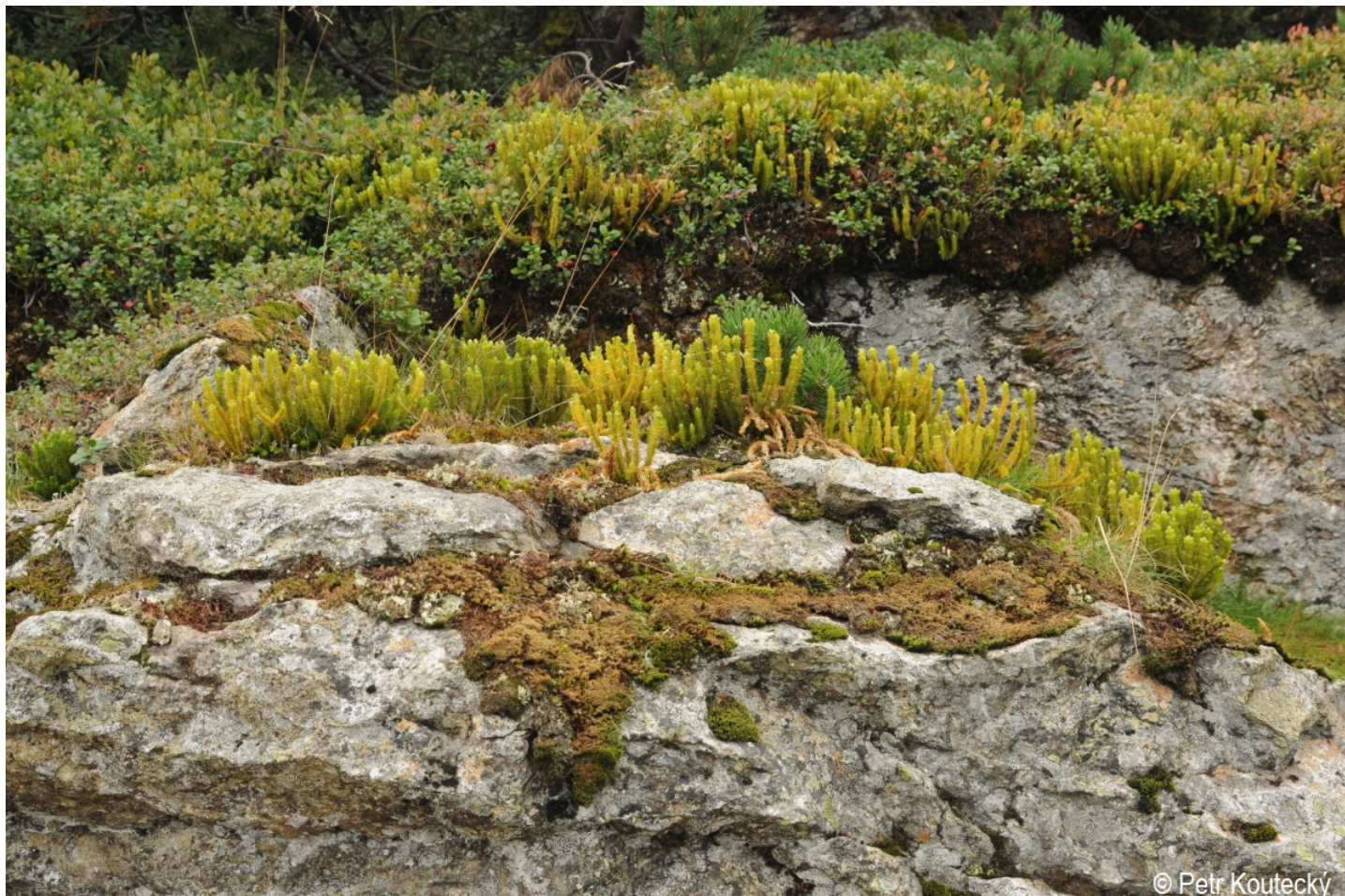
Huperzia selago – Petr Koutecký – Velký Javor.