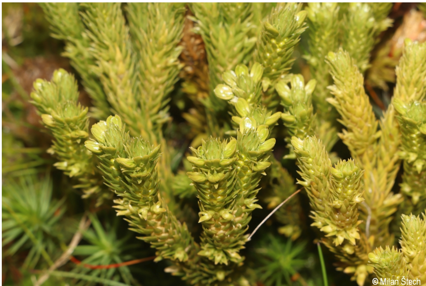
Huperzia selago – Milan Štech – Lakaberg.