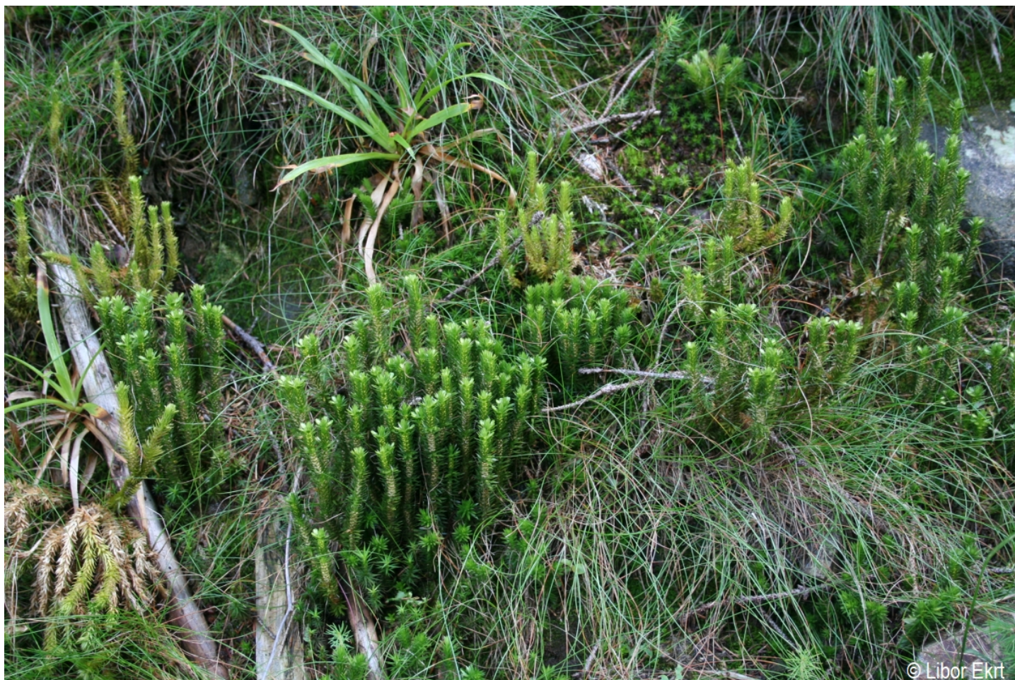
Huperzia selago – Libor Ekrť – Poledník.