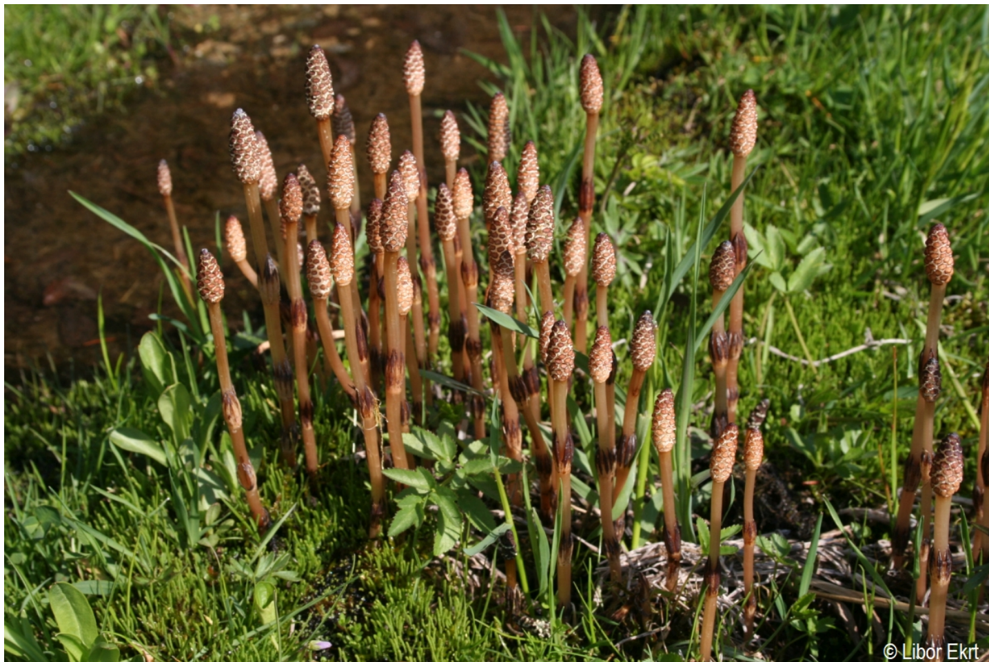
Equisetum arvense – Libor Ekrť – České Žleby.