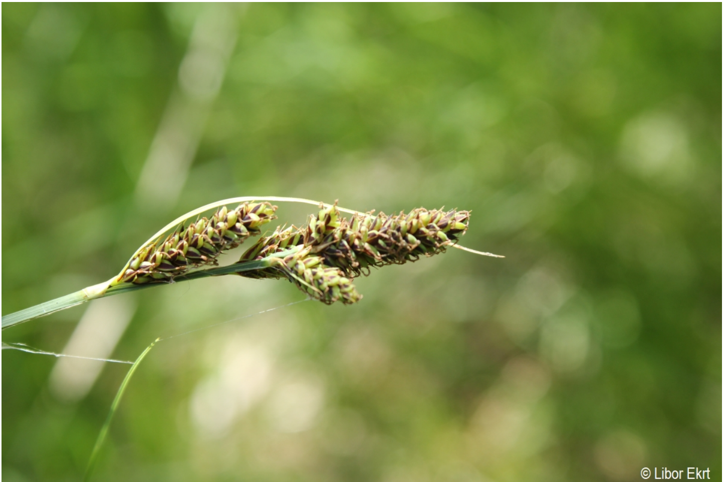
Carex hartmanii – Libor Ekrť – Černá v Pošumaví.