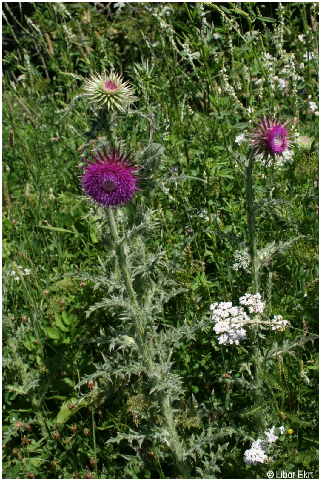
Carduus nutans – Libor Ekrť – Paště.