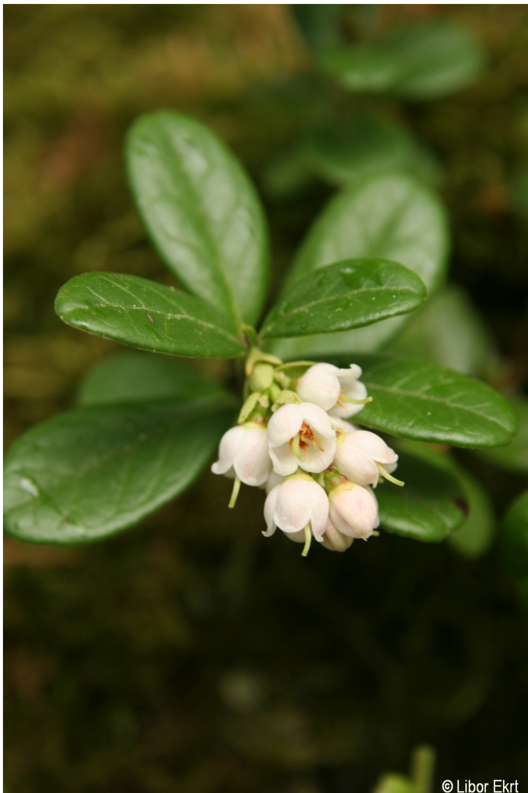
Vaccinium vitis-idaea – Libor Ekrť – Jelení Vrchy.