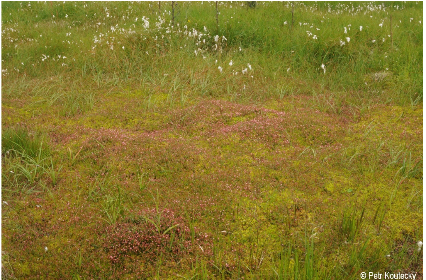
Vaccinium oxycoccos – Petr Koutecký – Strážný, pramen Časté.