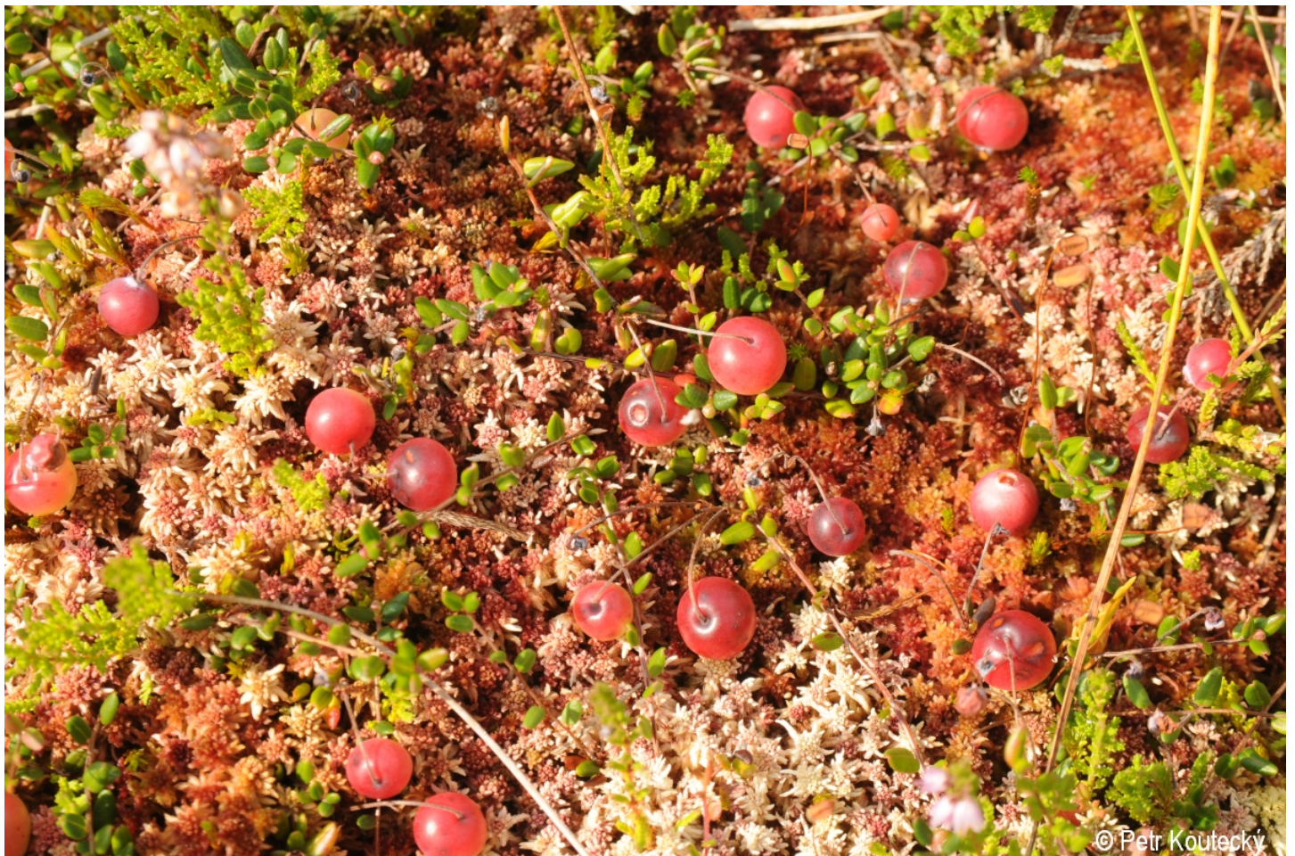
Vaccinium oxycoccos – Petr Koučeký – Chlum, Vltava.