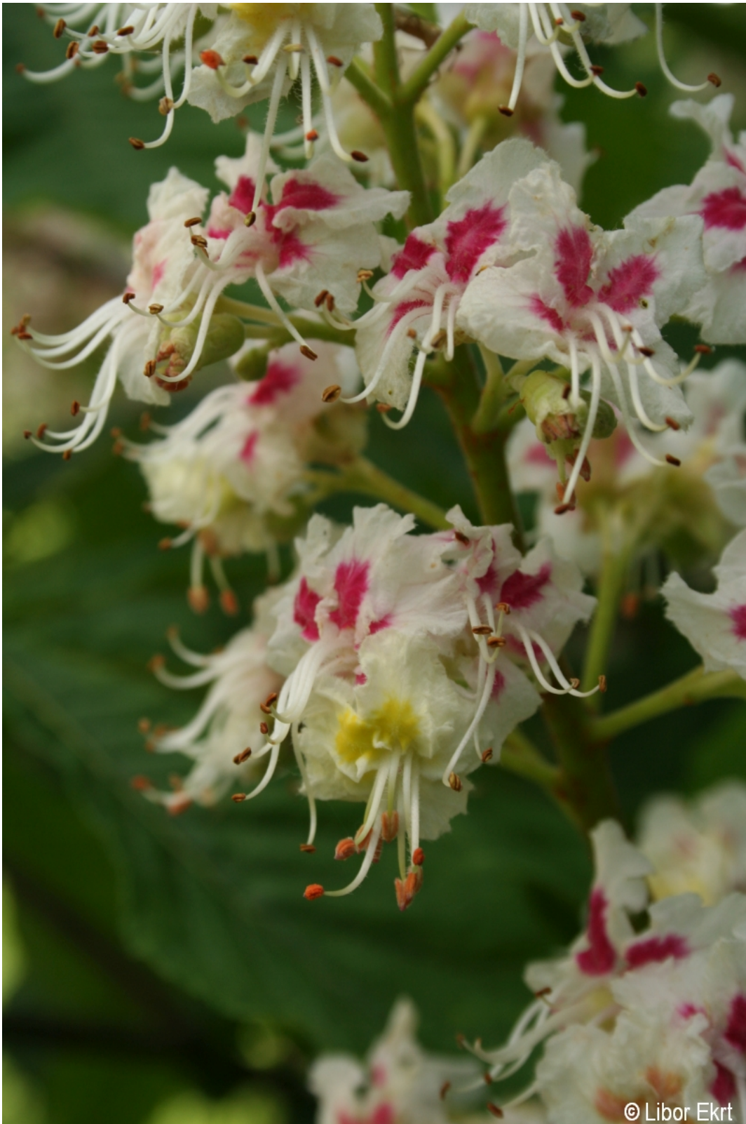
Aesculus hippocastanum – Libor Ekrť – Chaloupky.