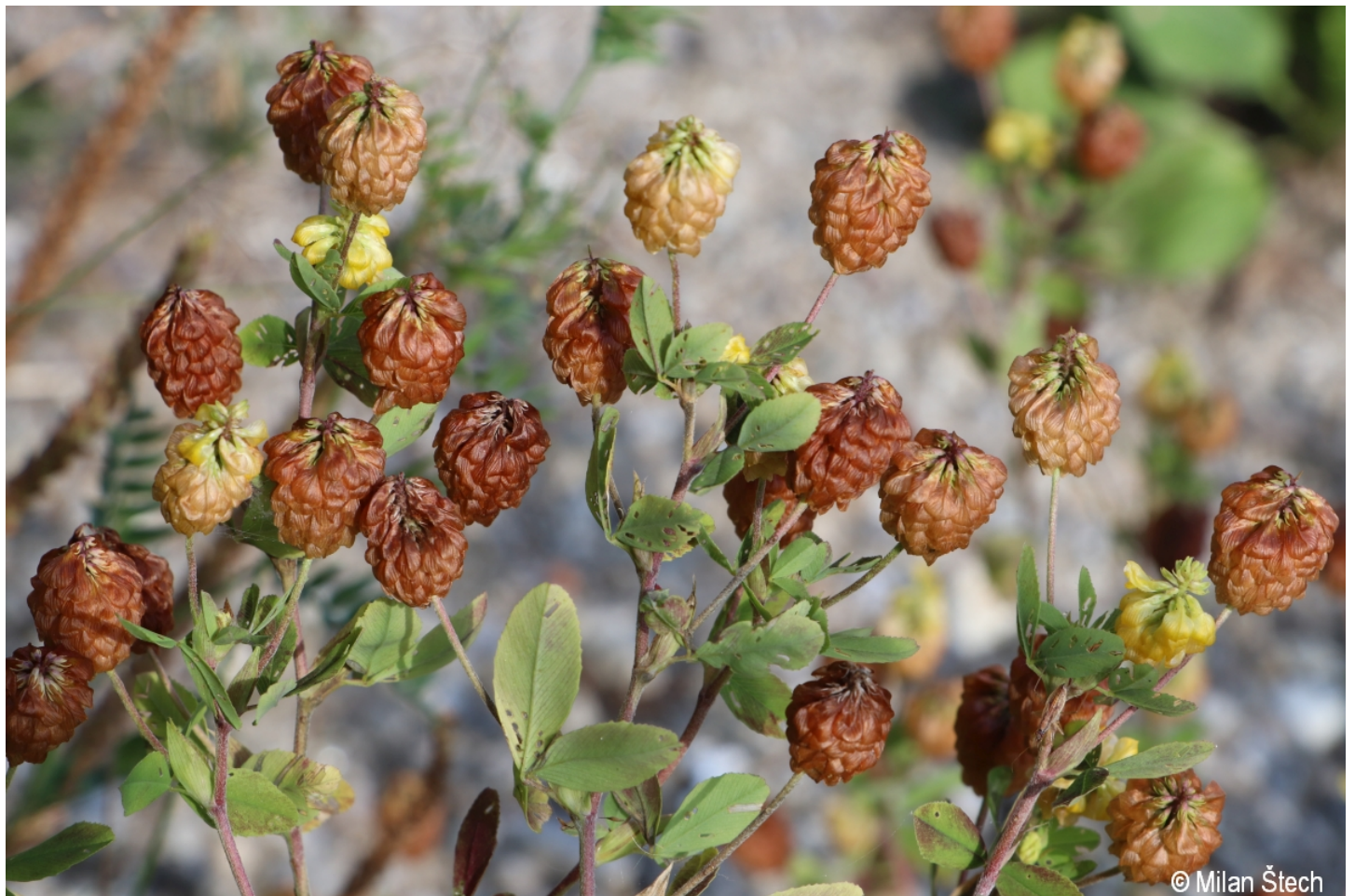
Trifolium aureum – Milan Štech – Lenora.