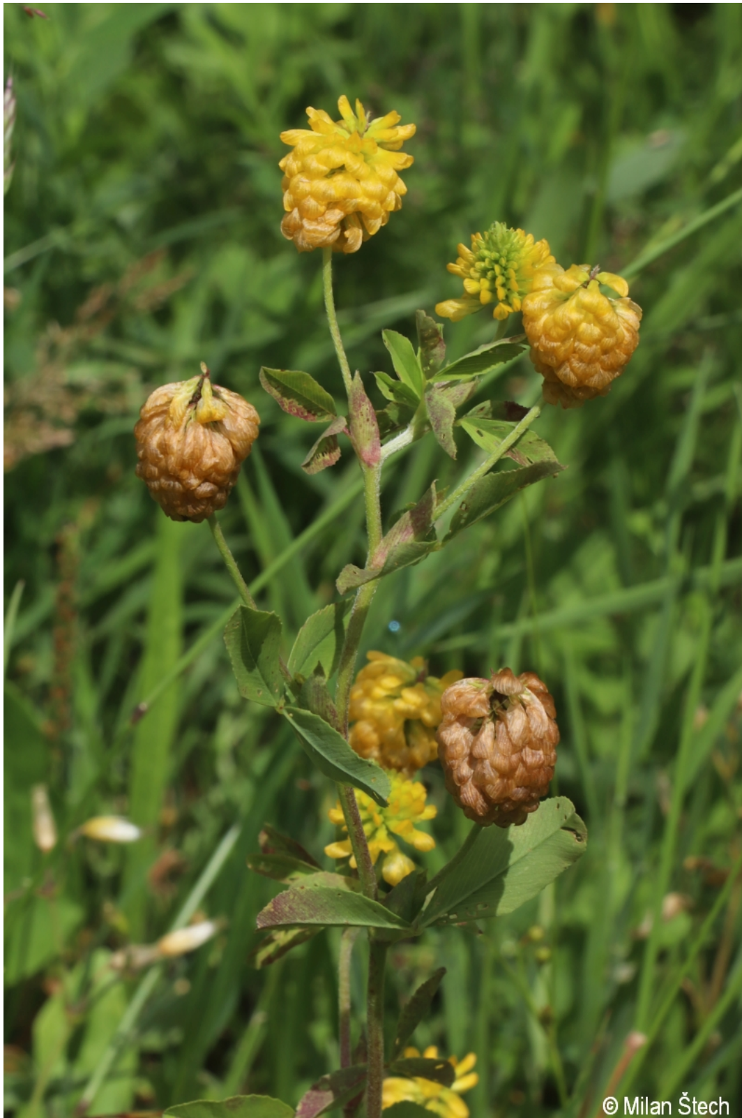
Trifolium aureum – Milan Štech – Kapličky.