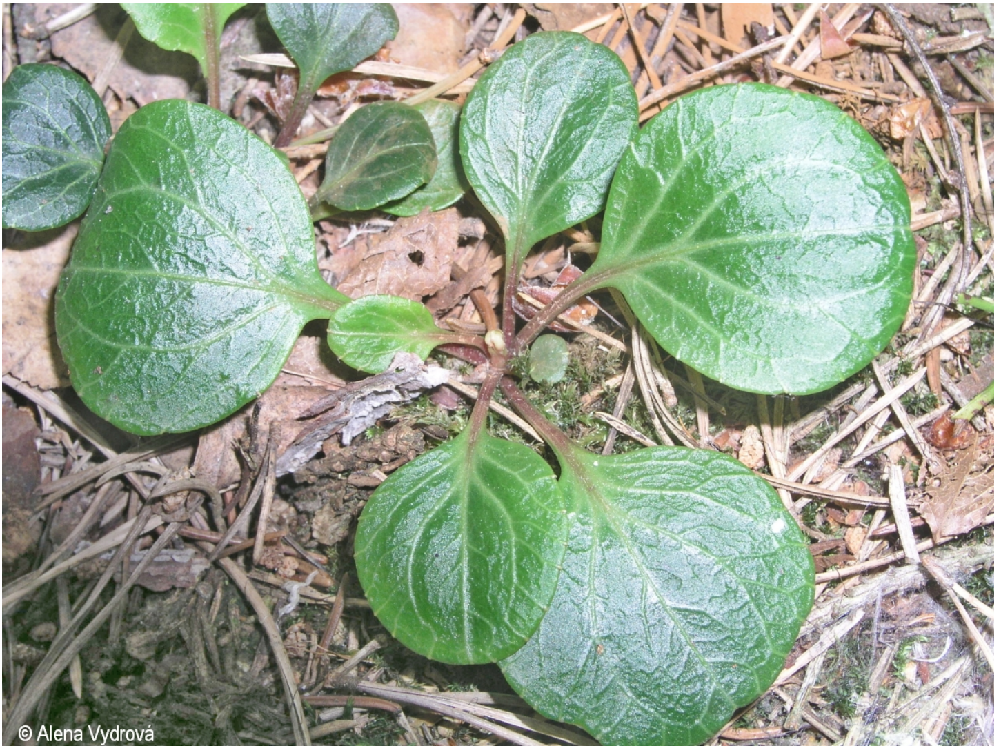
Pyrola chlorantha – Alena Vydrová – Boletice.