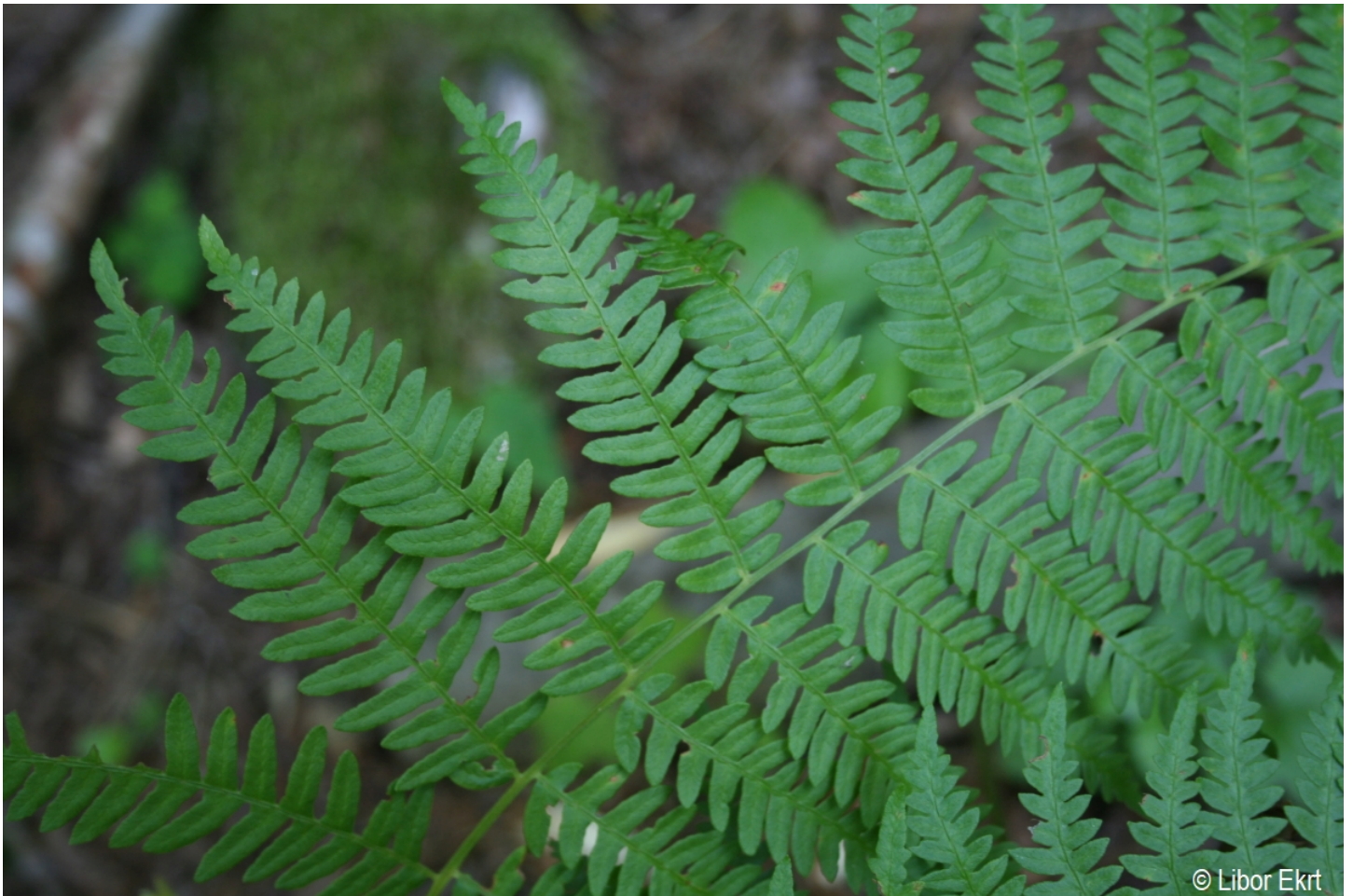
Pteridium aquilinum – Libor Ekrť – Paště.