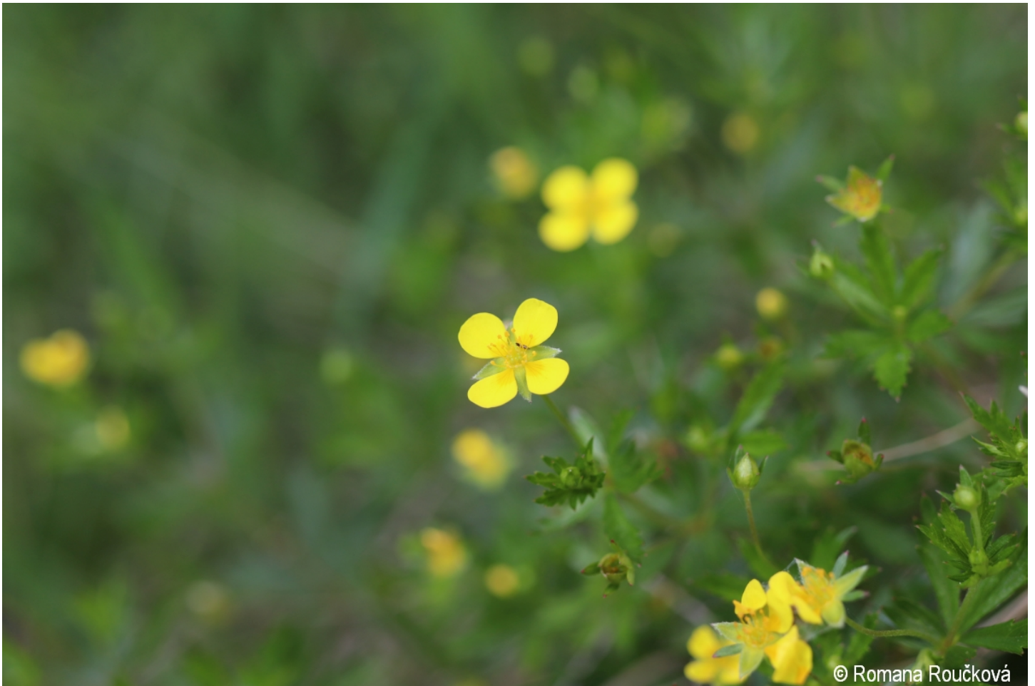
Potentilla erecta – Romana Roučková – Horský potok.