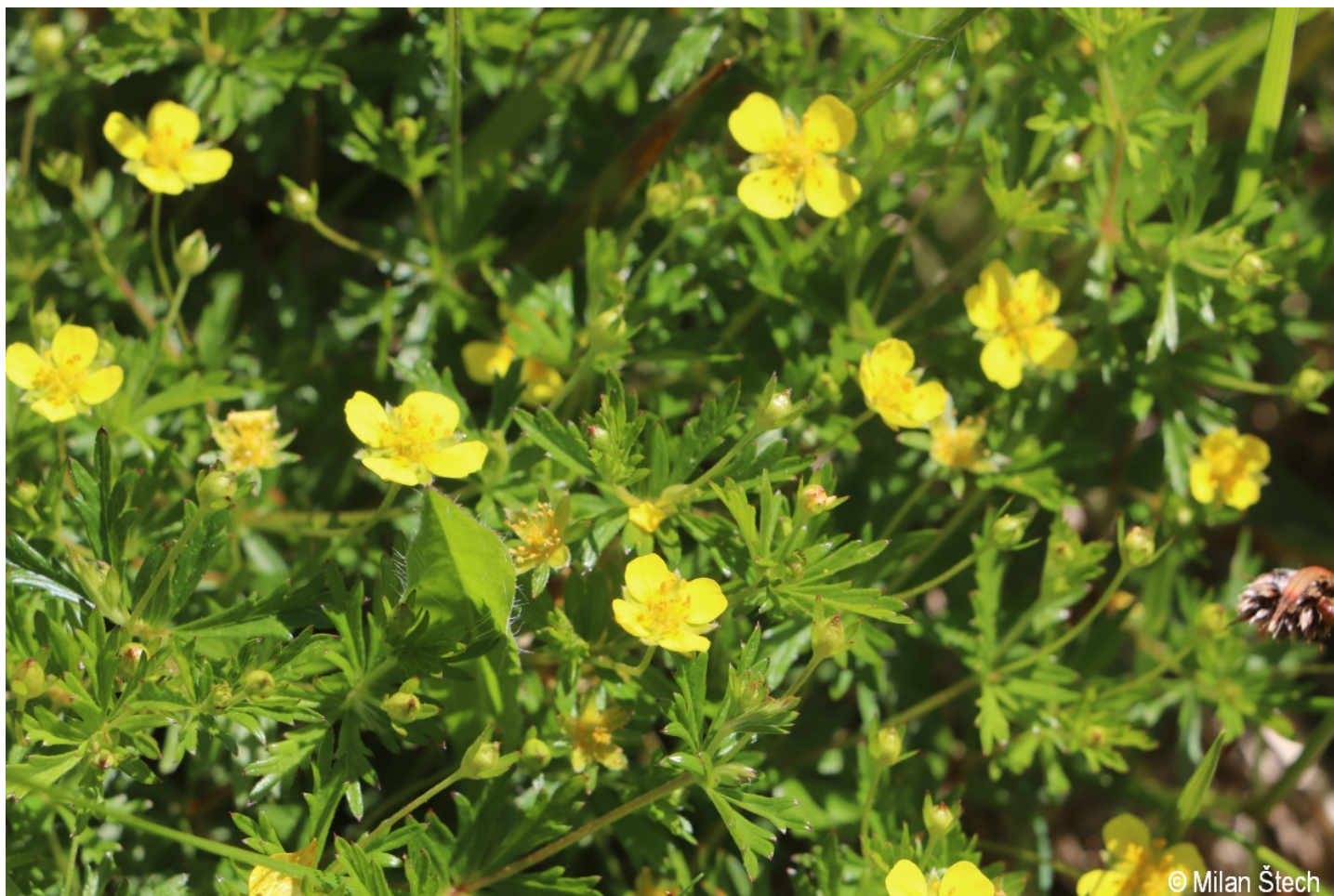
Potentilla erecta – Milan Štech – Rejštejnské Zhůří.