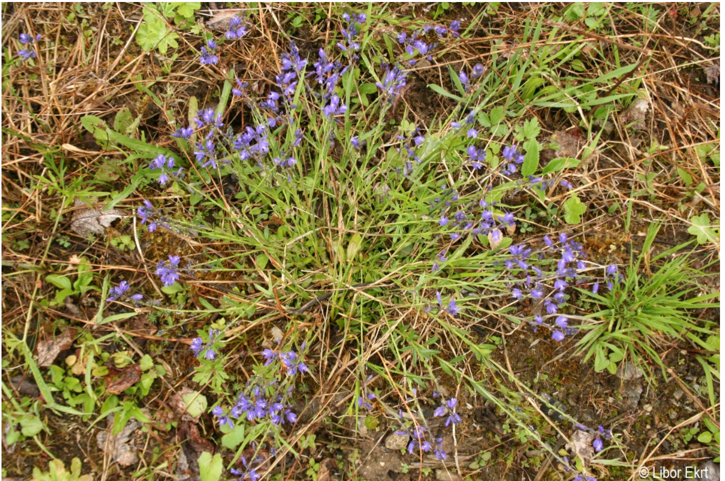
Polygala vulgaris – Libor Ekrť – Radost.