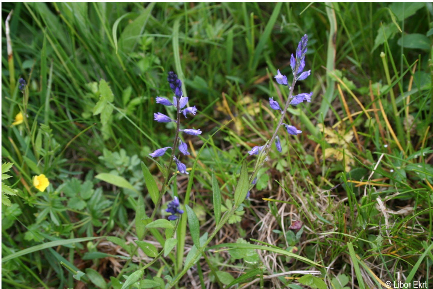
Polygala vulgaris – Libor Ekrt – Havránka.