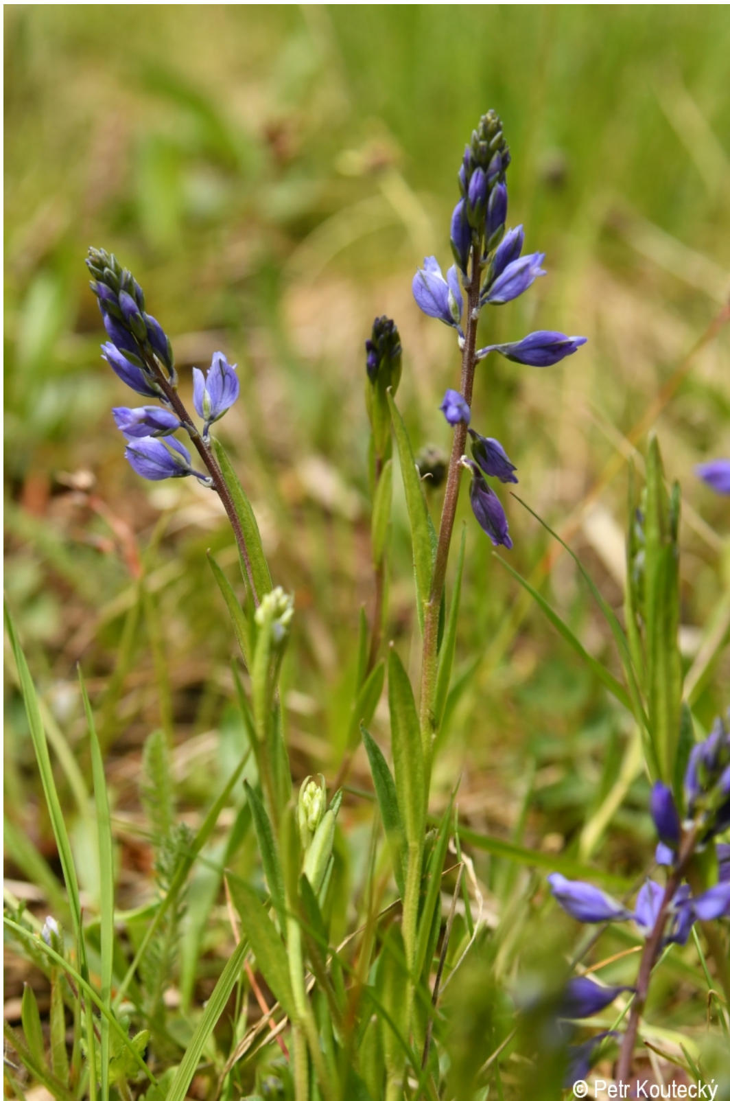
Polygala vulgaris – Petr Koutecký – Včelná pod Boubínem.