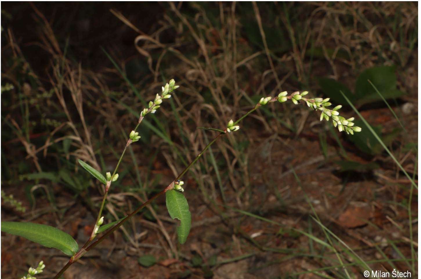
Persicaria mitis – Milan Štech – Lohberg.