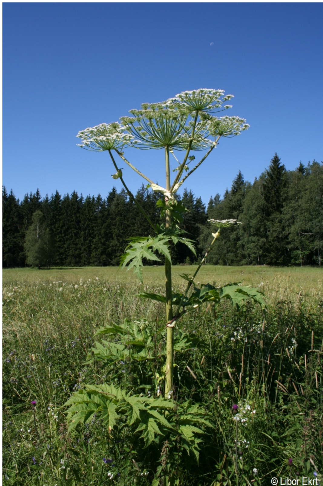
Heracleum mantegazzianum – Libor Ekrť – Strážný.