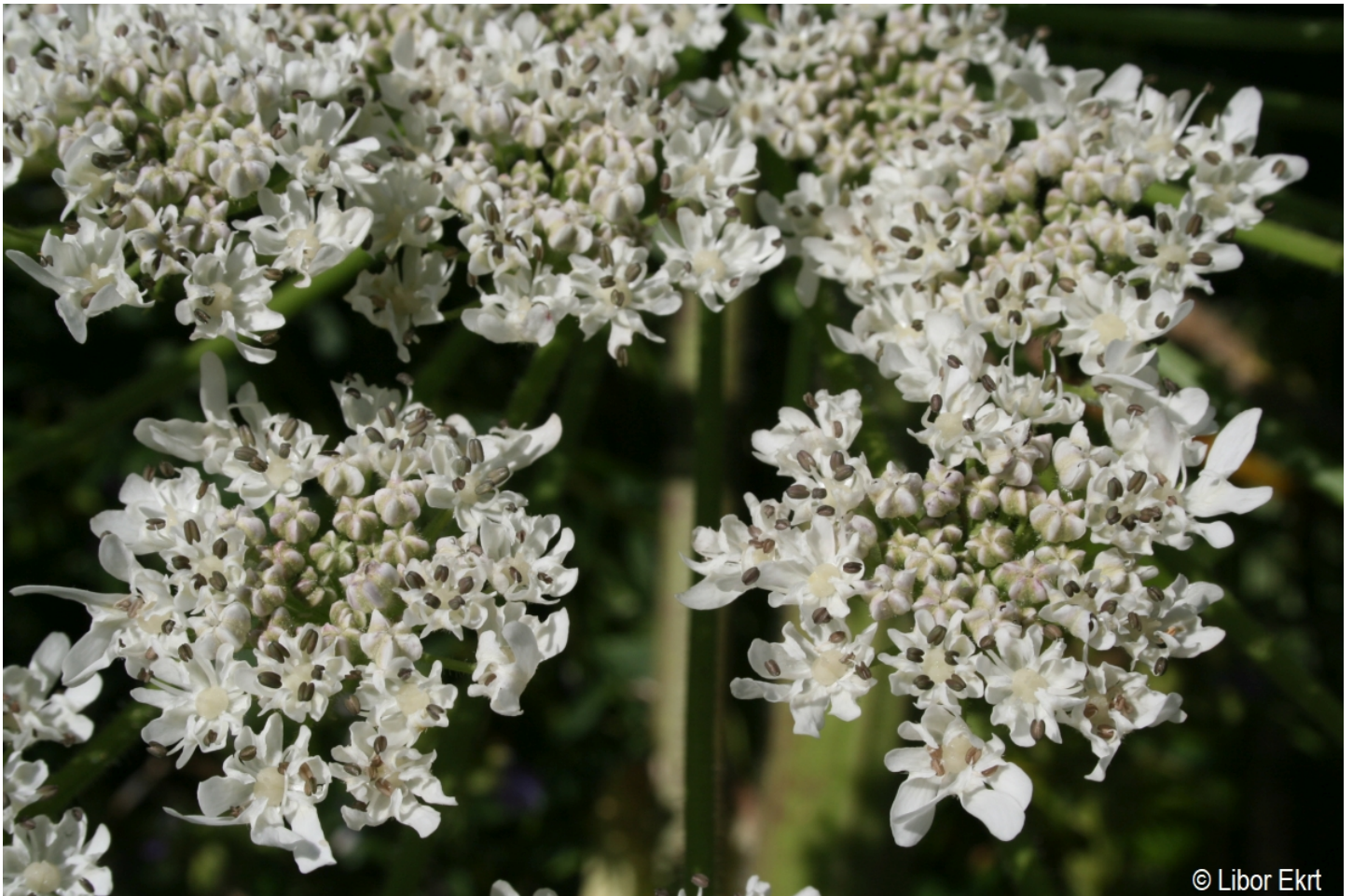
Heracleum mantegazzianum – Libor Ekrt – Strážný.