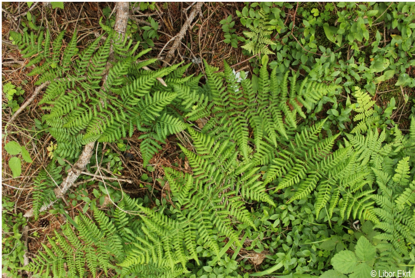
Dryopteris dilatata – Libor Ekrť – Černá v Pošumaví.