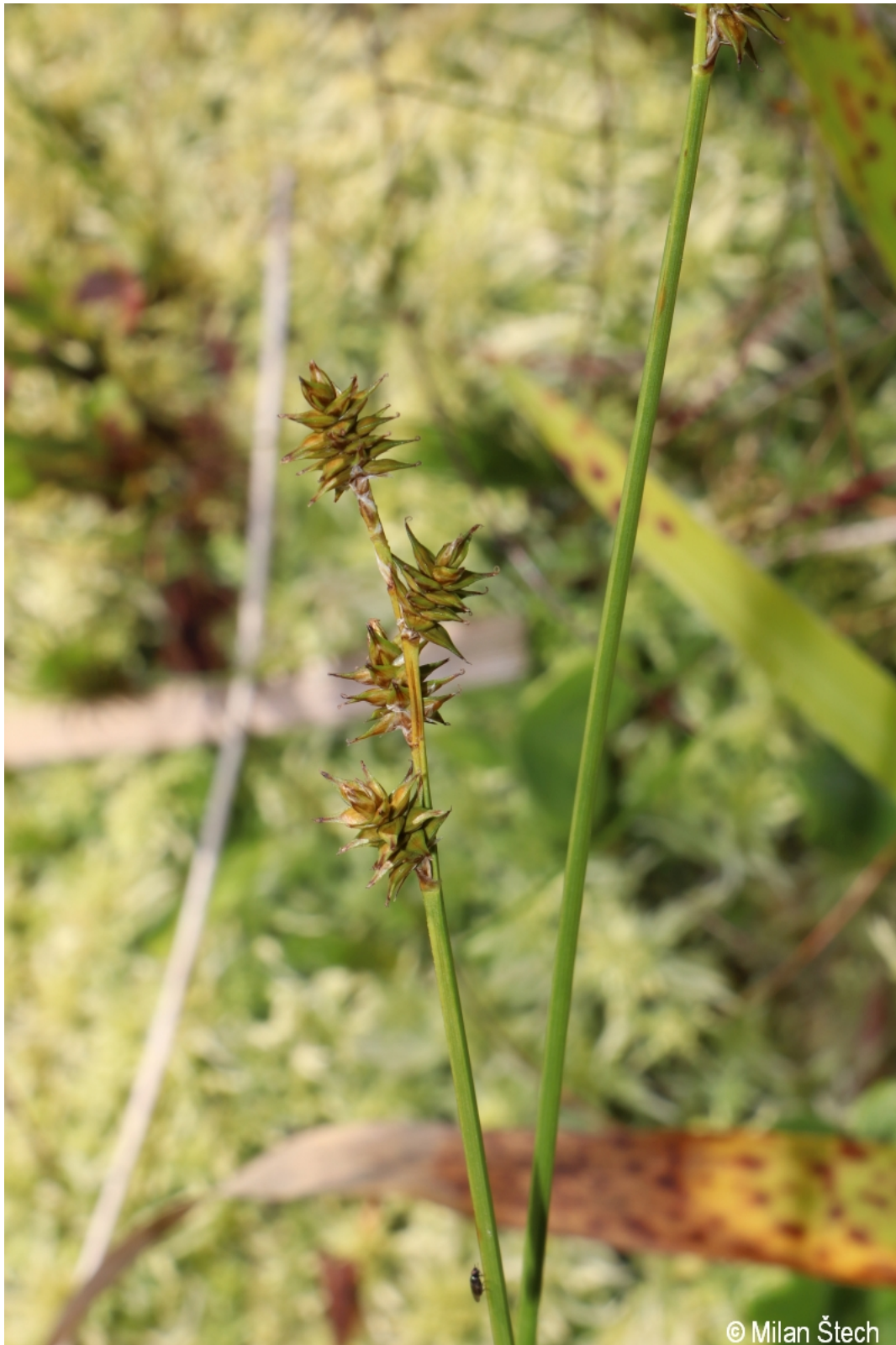
Carex echinata – Milan Štech – Třístoličník.