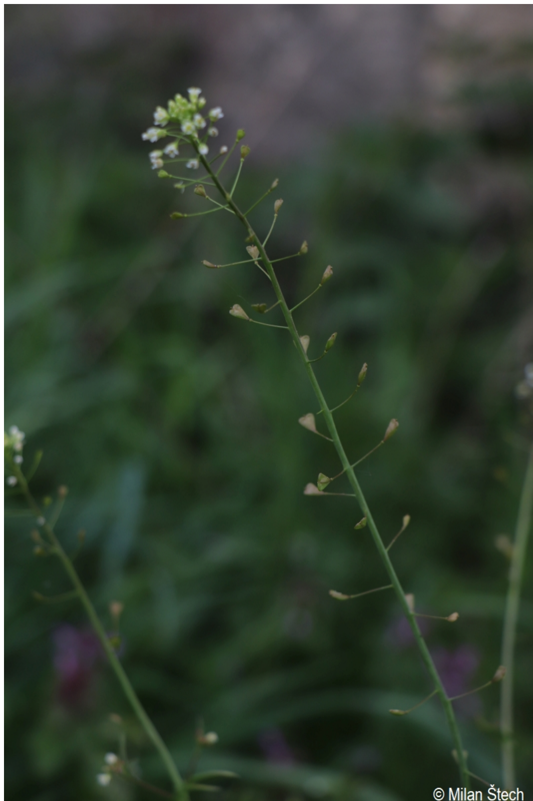
Capsella bursa-pastoris – Milan Štech – Pěkná.