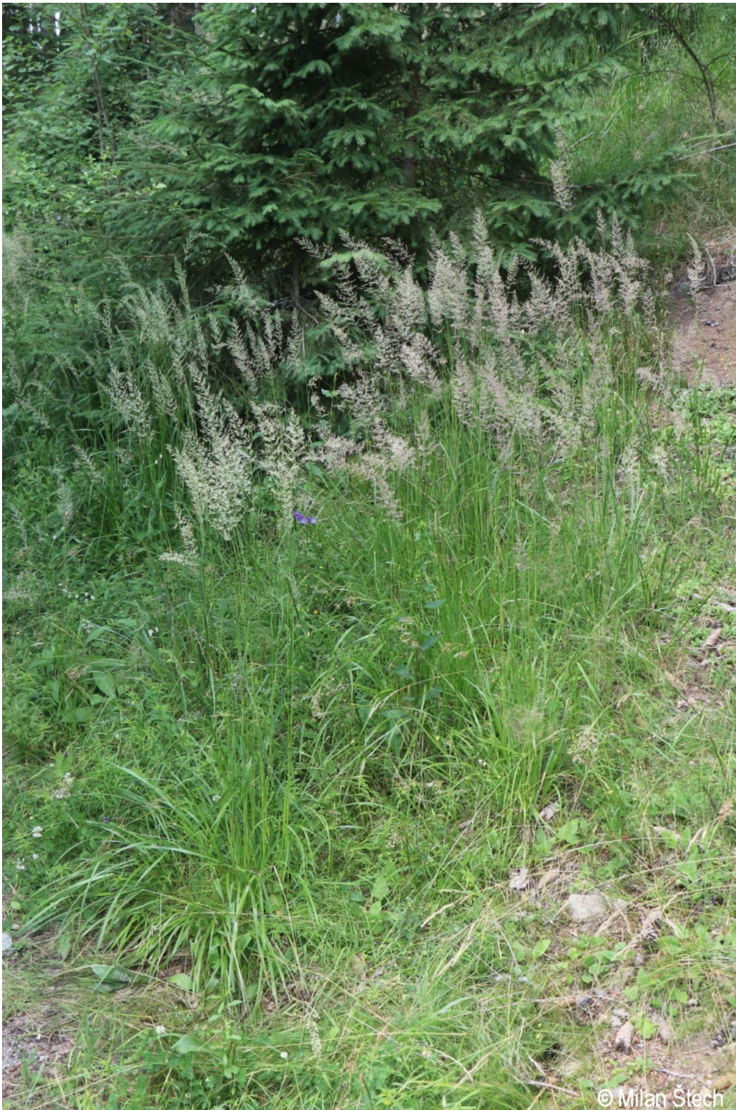
Calamagrostis arundinacea – Milan Štech – Nová Pec, Hojsova Pila.