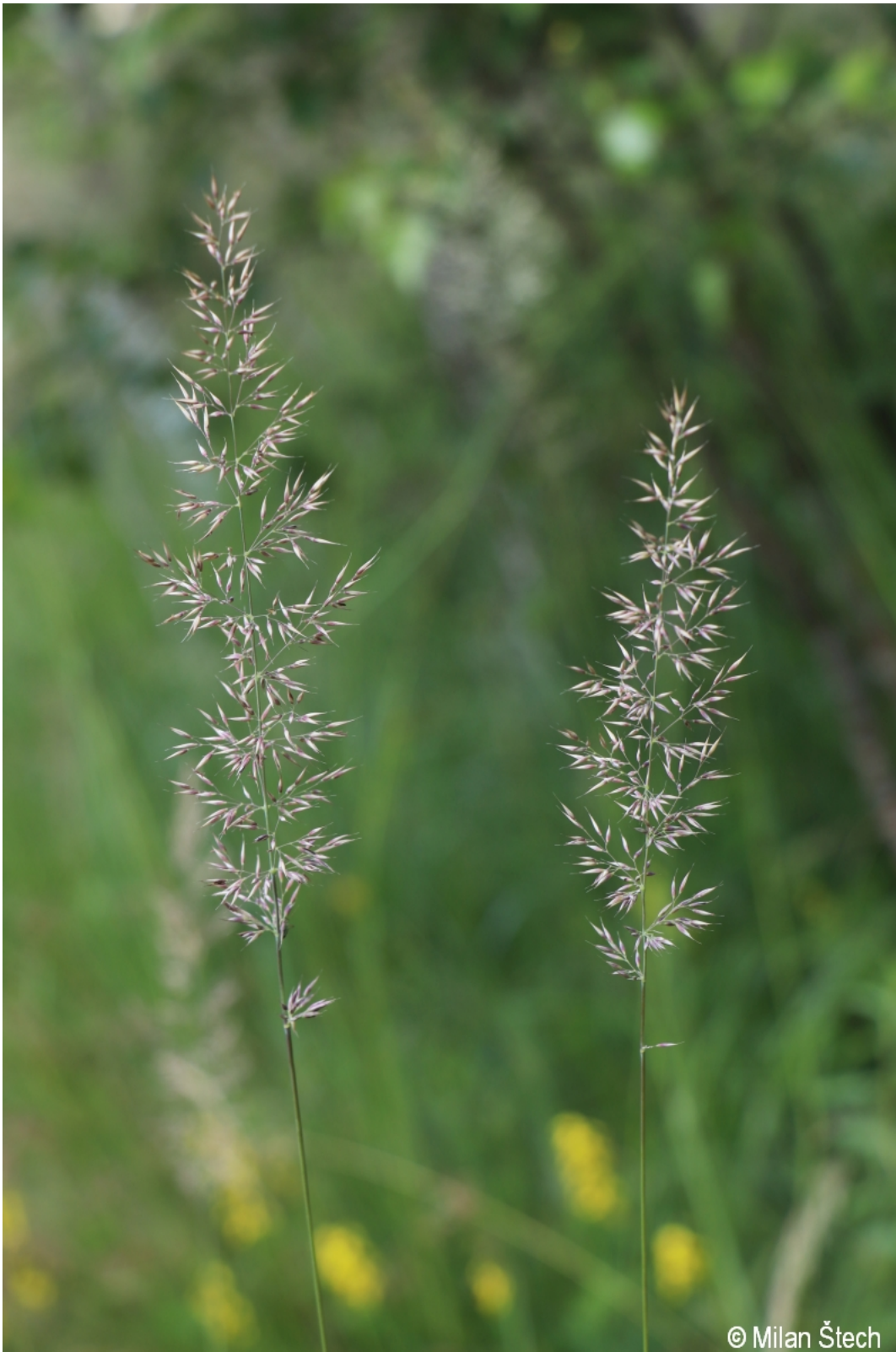
Calamagrostis arundinacea – Milan Štech – Nová Pec, Hojsova Pila.