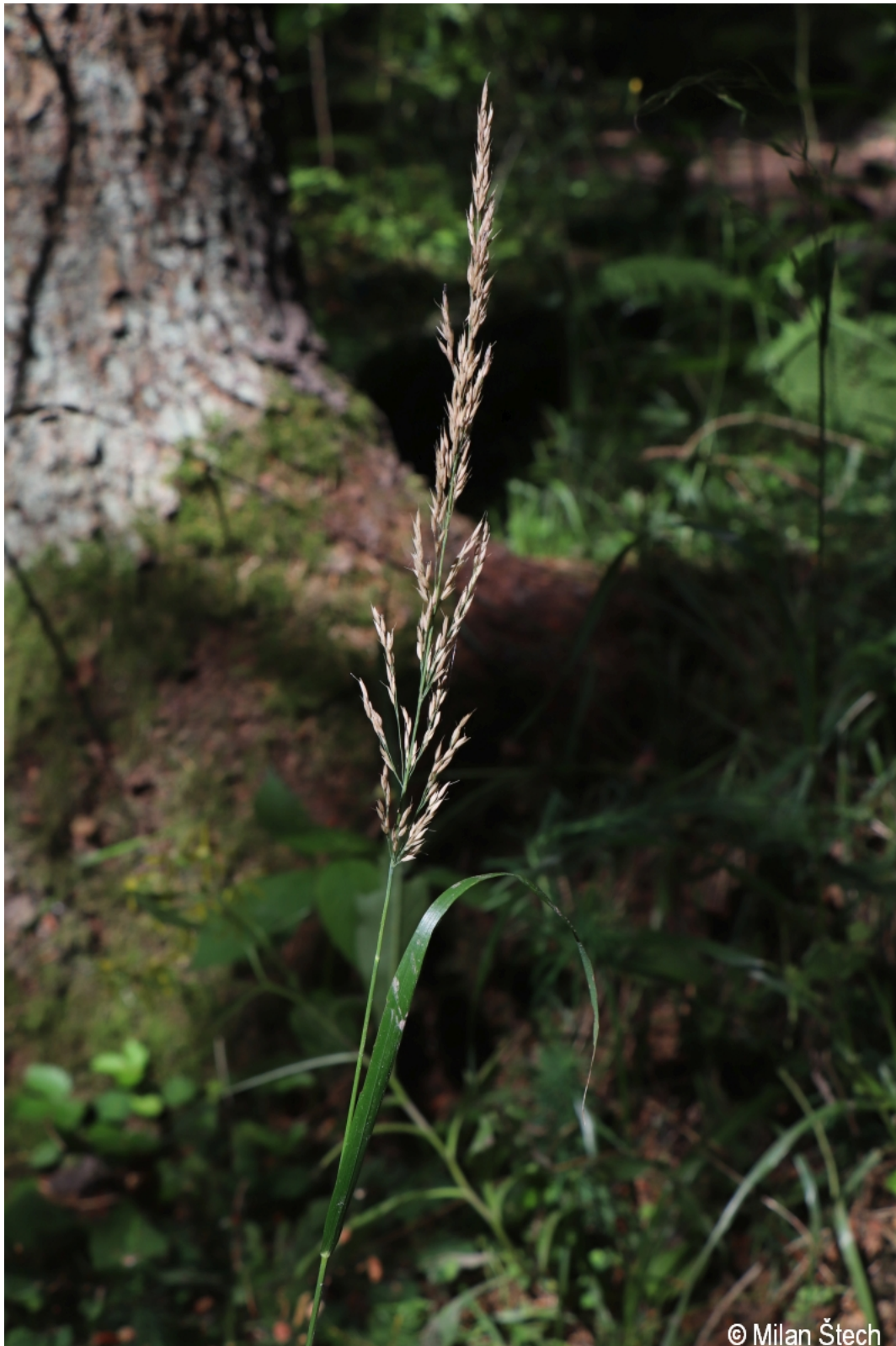
Calamagrostis arundinacea – Milan Štech – Olšina.