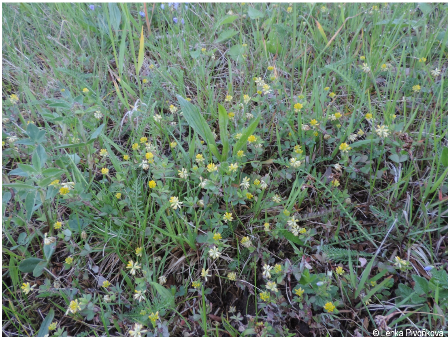
Trifolium dubium – Lenka Pivoňková – Děpoltice.