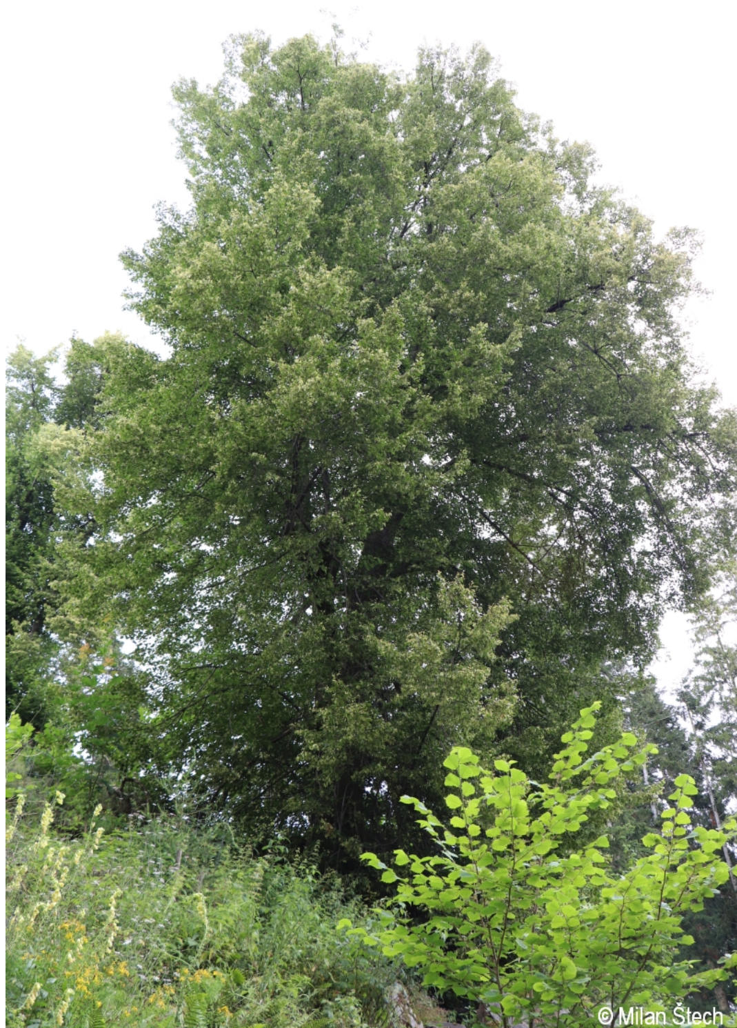
Tilia cordata – Milan Štech – Karlovy Dvory.