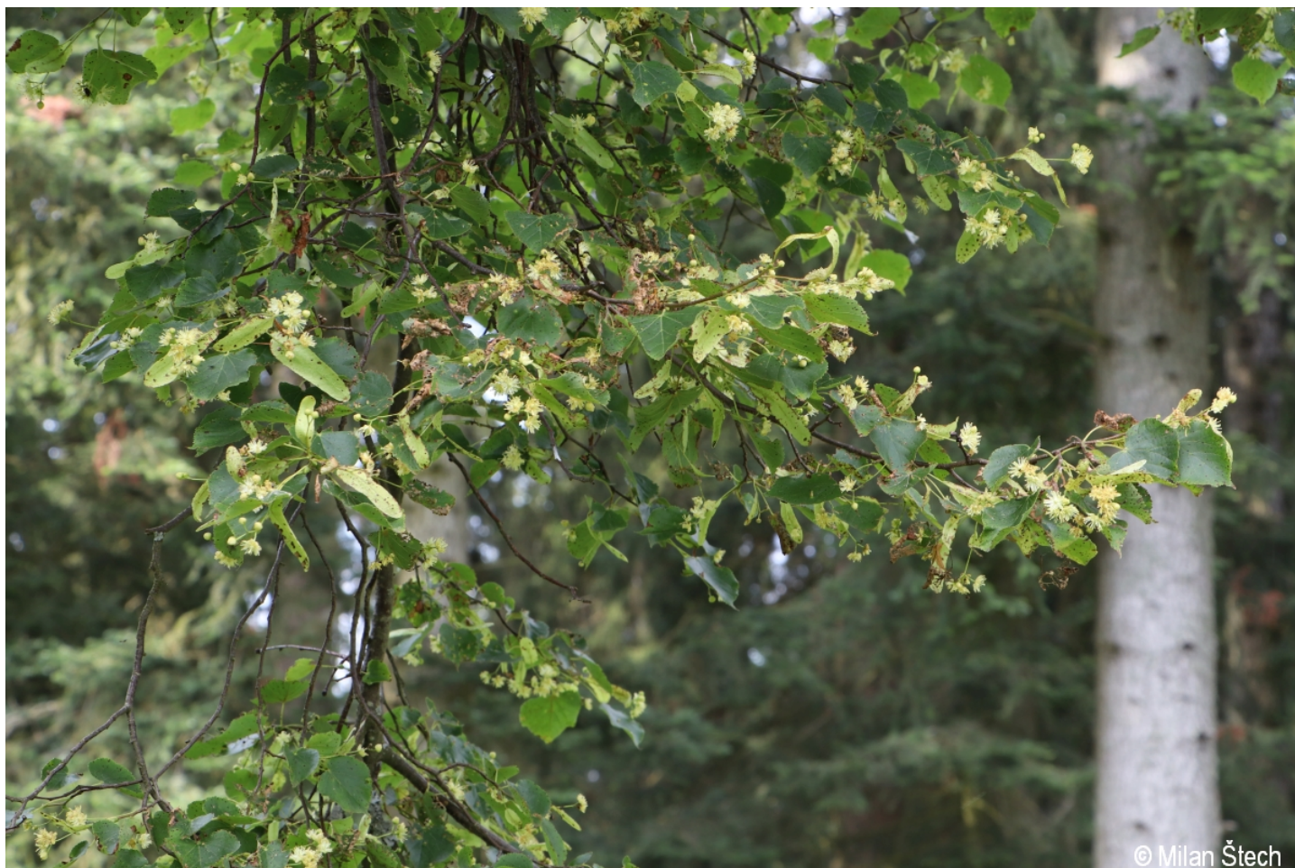
Tilia cordata – Milan Štech – Karlovy Dvory.