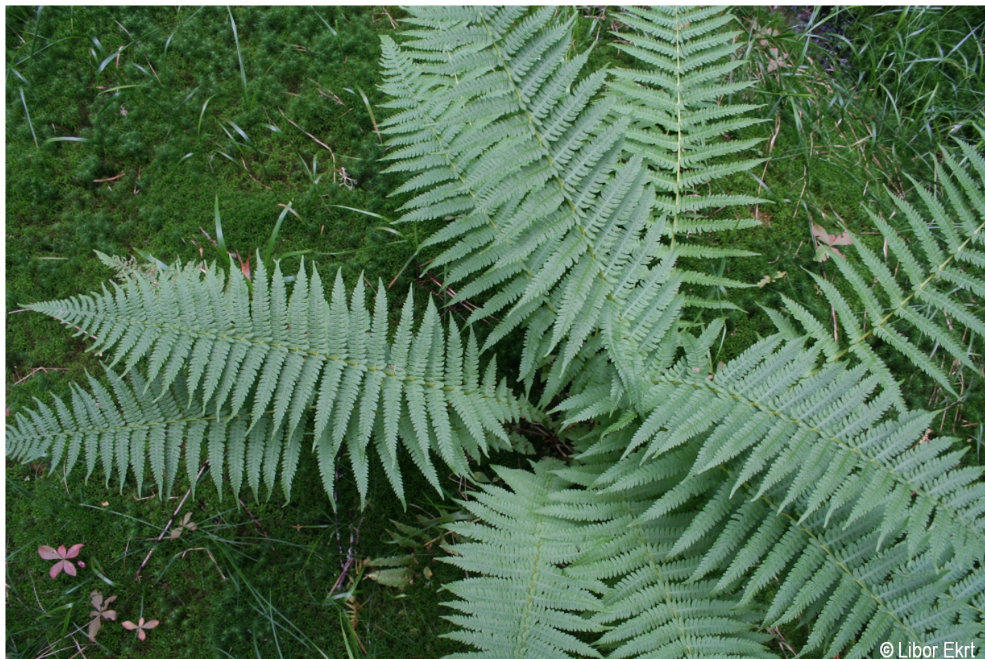
Oreopteris limbosperma – Libor Ekrt – Stará Jímka.