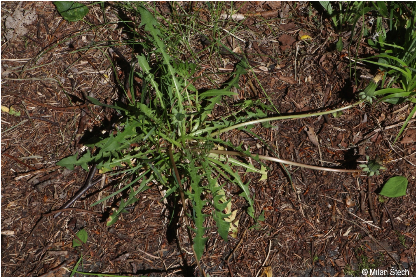
Taraxacum hercynicum – Milan Štech – Rejštejnské Zhůří.