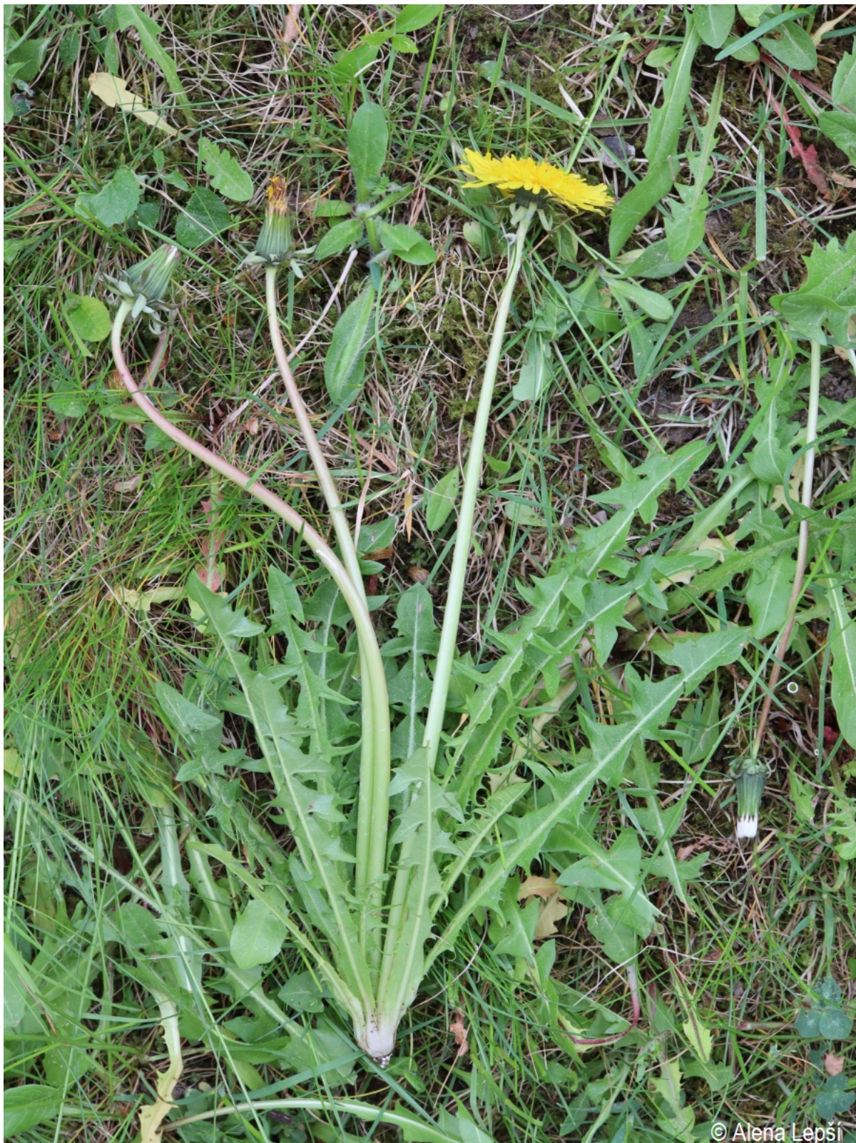
Taraxacum ingens – Alena Lepší – Hartmanice.