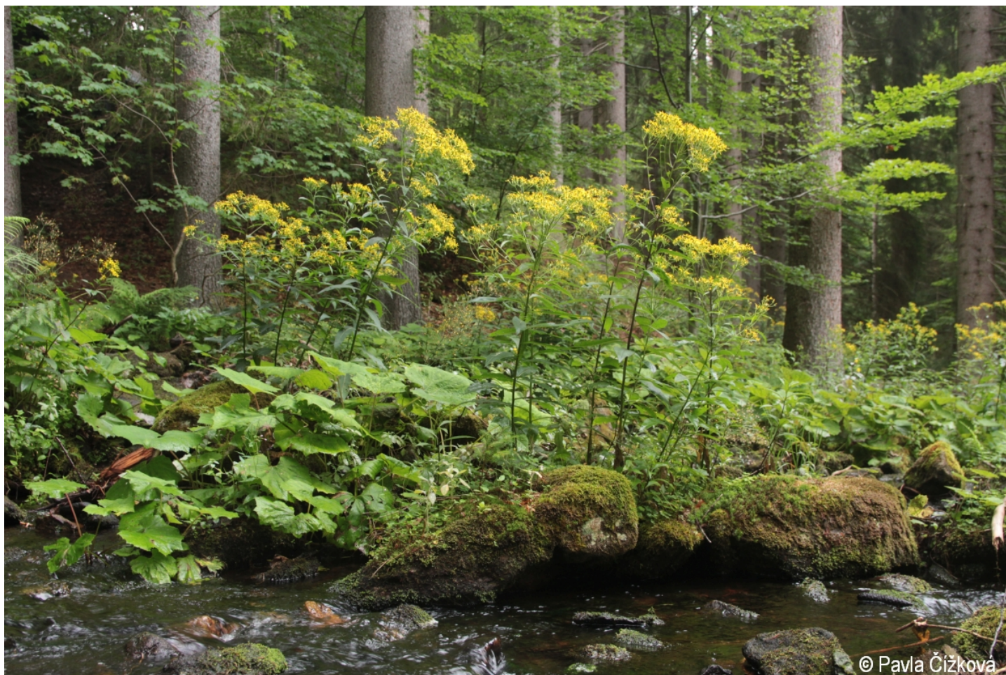
Senecio ovatus – Pavla Čížková – Boubínské jezírko.