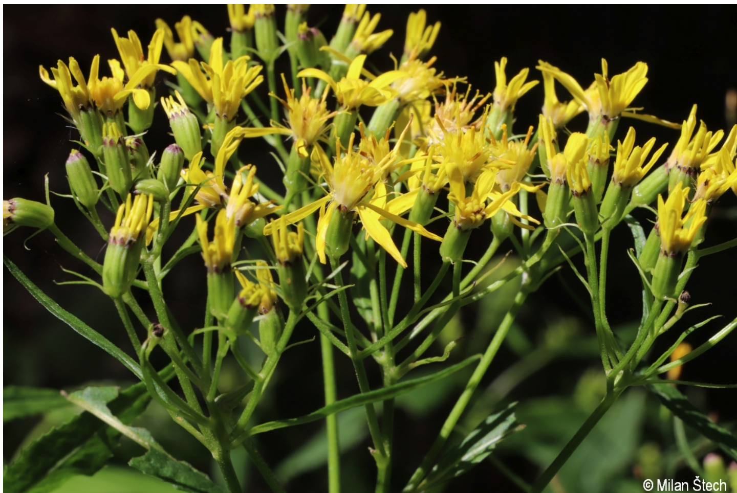
Senecio ovatus – Milan Štech – Horská Kvilda, Stará Huť u Zhůří.