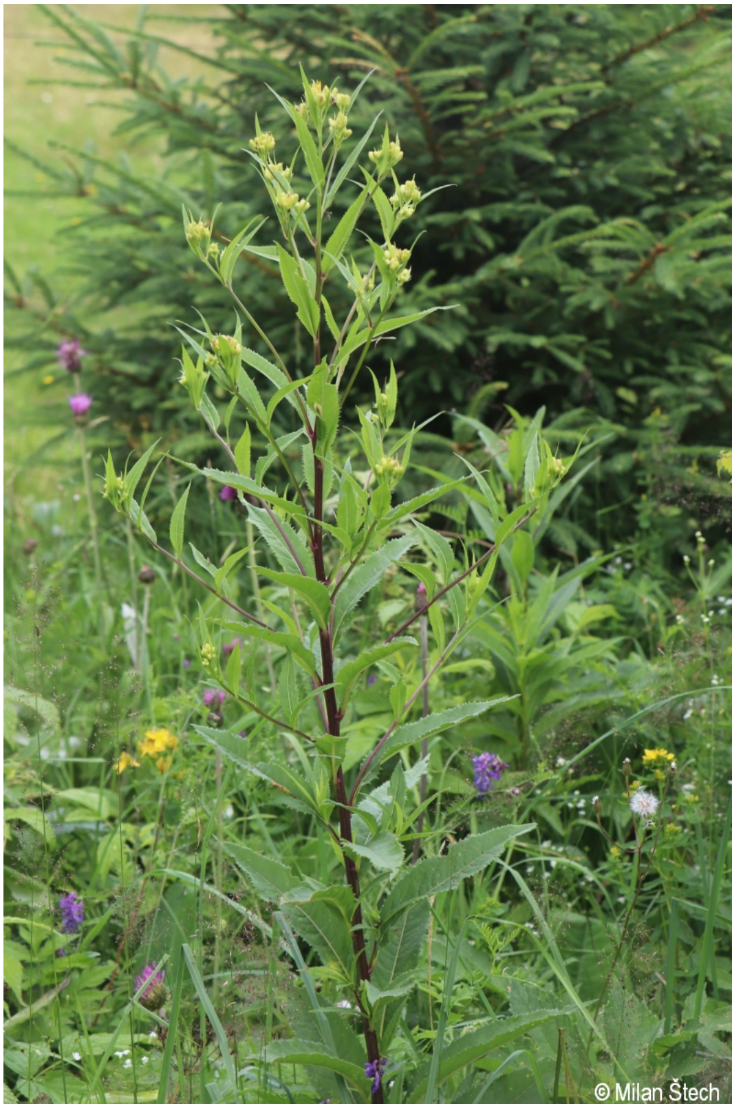
Senecio ovatus – Milan Štech – Knížecí Pláně.