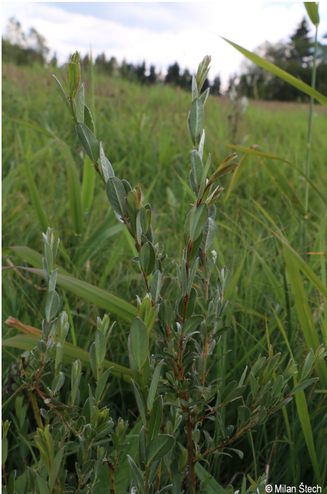
Salix repens – Milan Štech – Stögrova Huť.