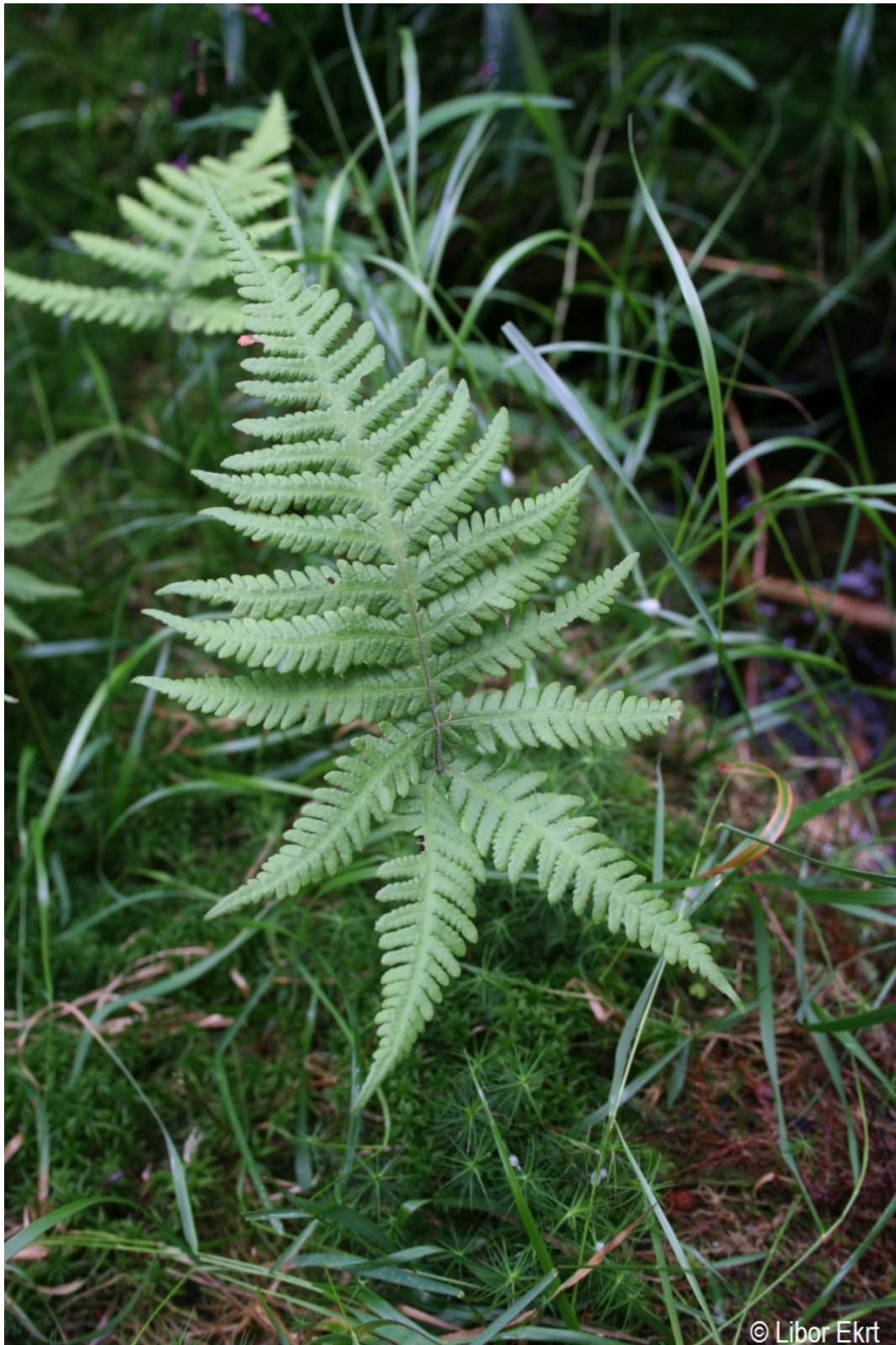
Phegopteris connectilis – Libor Ekrt – Prášily, Stará jímka.