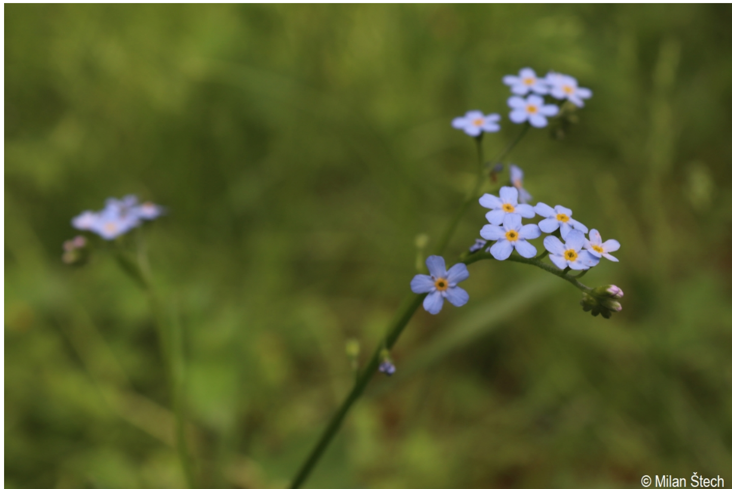
Myosotis nemorosa – Milan Štech – Rašeliniště Bobovec.