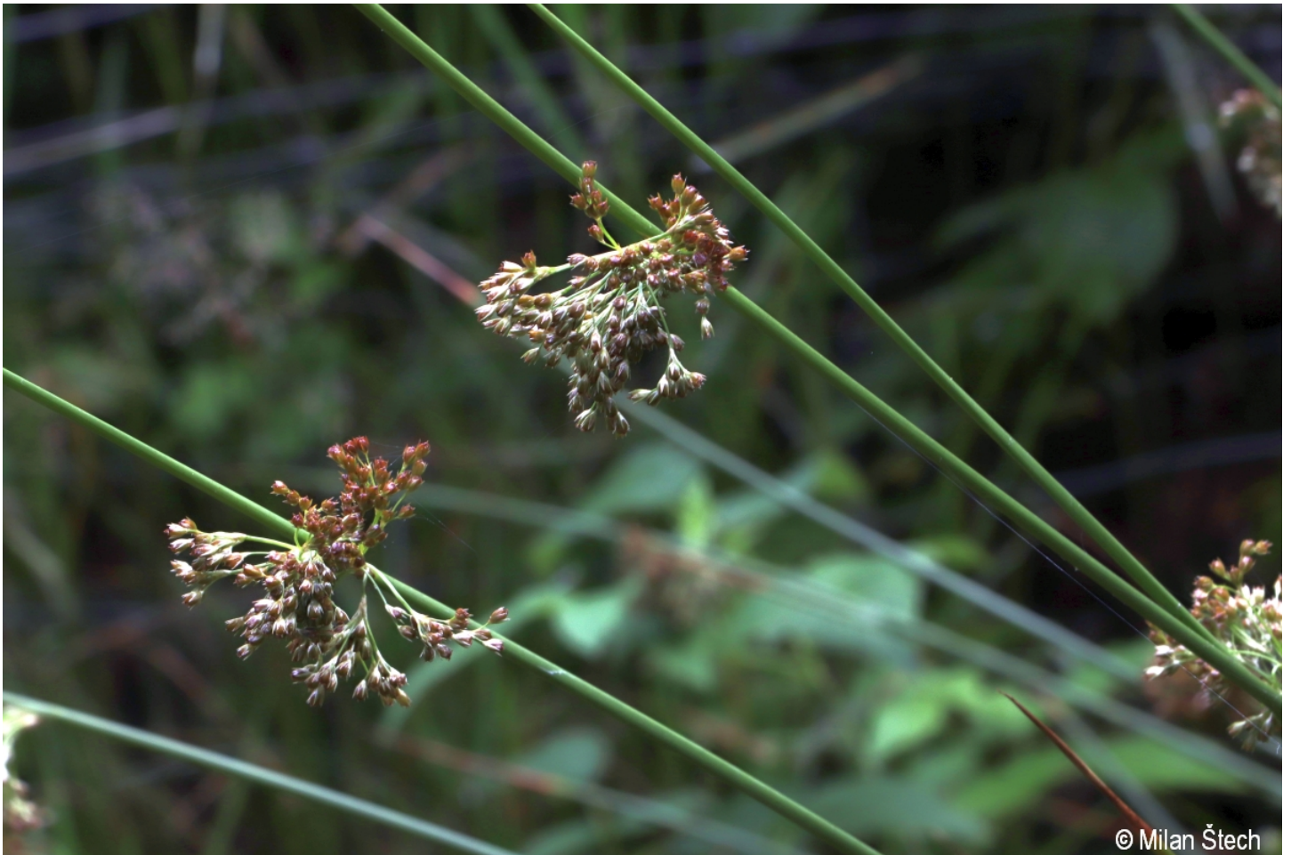
Juncus effusus – Milan Štech – Bližná.