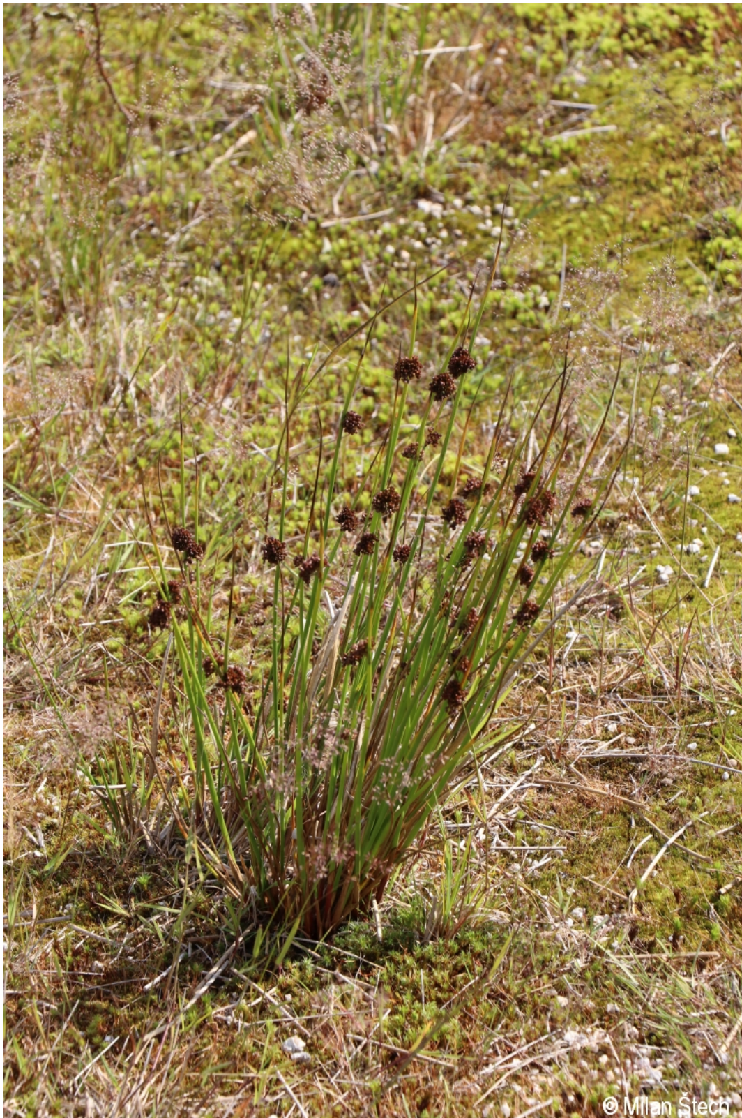
Juncus effusus – Milan Štech – Třístoličník.